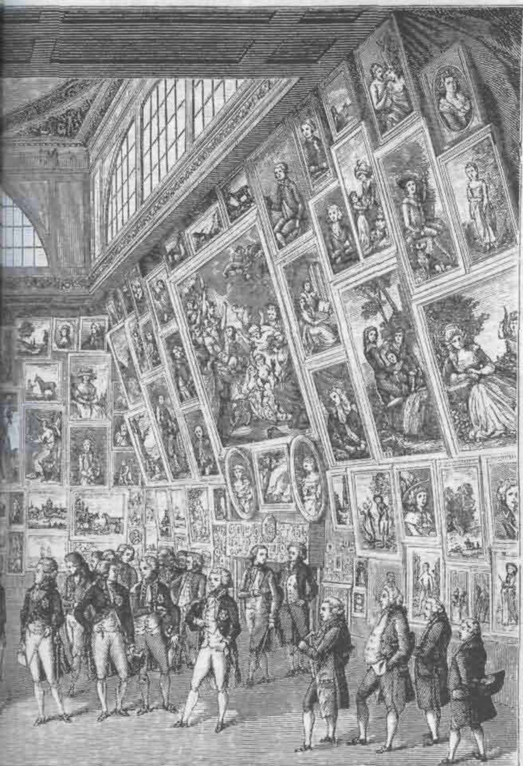
Общество 1789 г. По картине Рамбера

Версаль целое утро кишел разряженными франтами; они вертелись перед зеркалами, прикрепляли ленты, приглаживали парики. Как только приходило известие о войне, дворец мгновенно пустел, и те же разряженные щеголи летели на битву как на бал. Они хорошо говорили, были льстивы, обходительны и вежливы. Король снимает шляпу при встрече с простой горничной. Учтивый герцог, идя по Версалю, должен был держать шляпу в руке. «Весь этот двор был прелестным садом с нежными растениями и столь тонким запахом, что мы теперь, в наш суровый, все уравнивающий век, можем с трудом вызвать перед собою верное представление о них» (рис. 717).