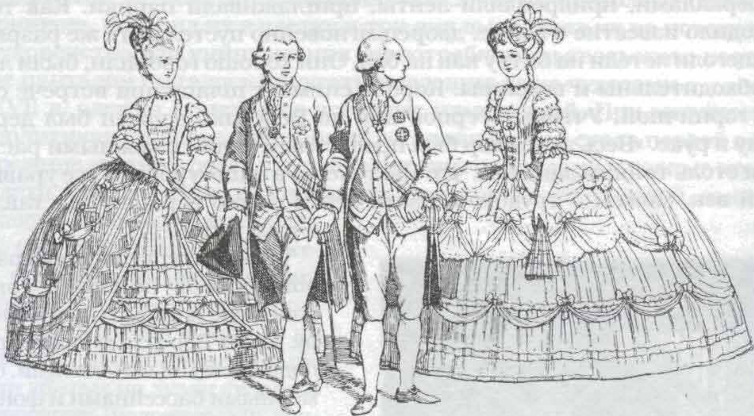
Рис. 714. Костюмы при дворе императора Иосифа II.

Прическа к концу XVII и в начале XVIII вв. стала походить на мужской парик. Появились головные уборы почти в метр высотой; каждый элемент прически имел свое название: пустынный, герцог, капуста, спаржа, труба,