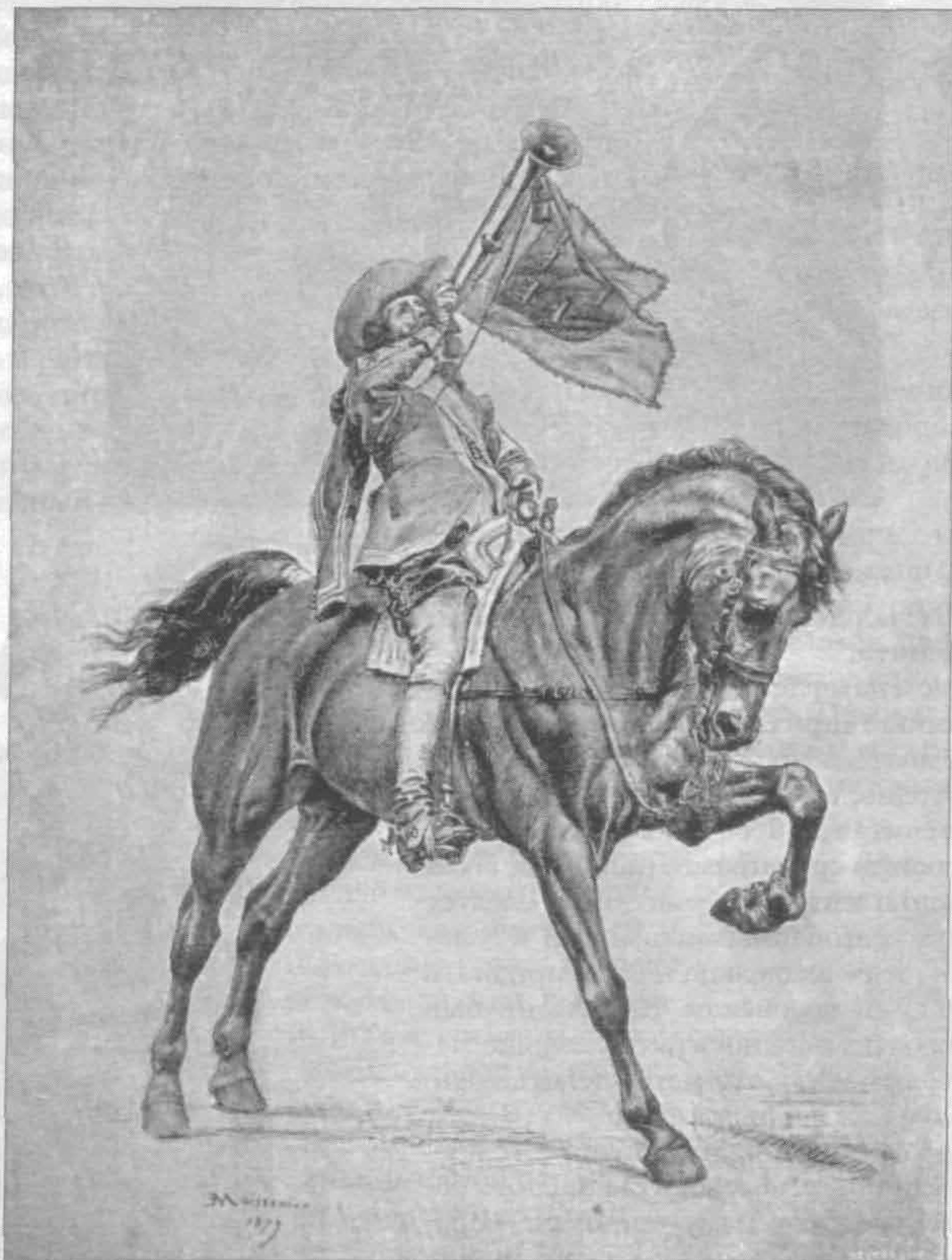
Рис. 707. Герольд эпохи Людовика XIII. По рисунку Месонье

на спину лошади. Шляпа плоская, как блюдо, поля у нее в полтора фута ширины; на ногах небольшой валик со сборками; на шее брыжи, похожие на жернов».