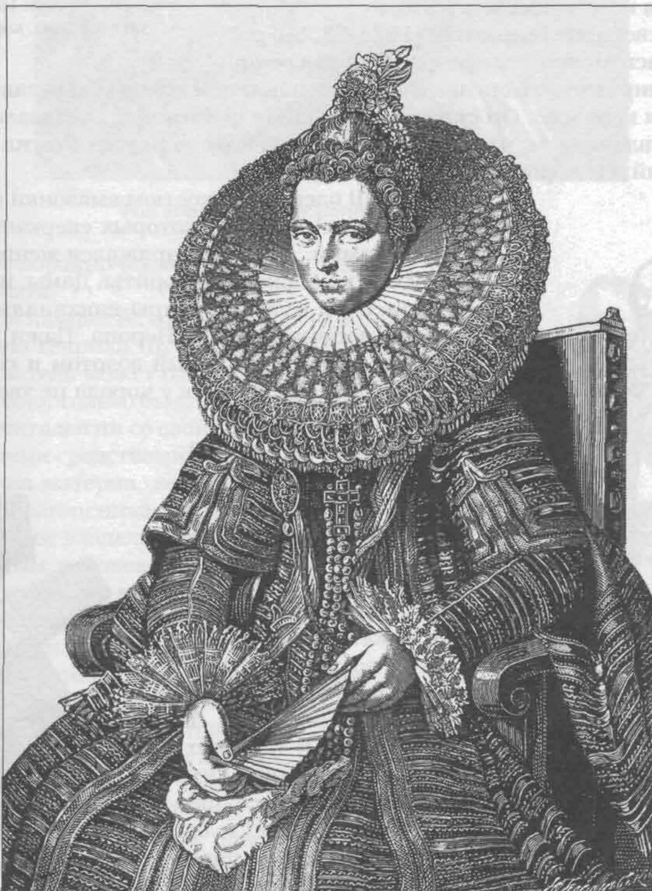
Рис. 701. Нидерландская мода начала XVII в. По портрету работы Рубенса

Свое влияние на моду оказывала и Испания, объединившая под властью Карла V и Филиппа II население самых разных европейских стран. Карл сначала одевался в германско-бургундский костюм; лишь утвердившись на престоле, облачился в испанское. Отличительным признаком испанского покроя был мавританский орнамент — арабески, вышитые золотом или серебром. Высшая аристократия носила темные и черные одежды, чтобы подчеркнуть белизну лица как доказательство отсутствия мавританской