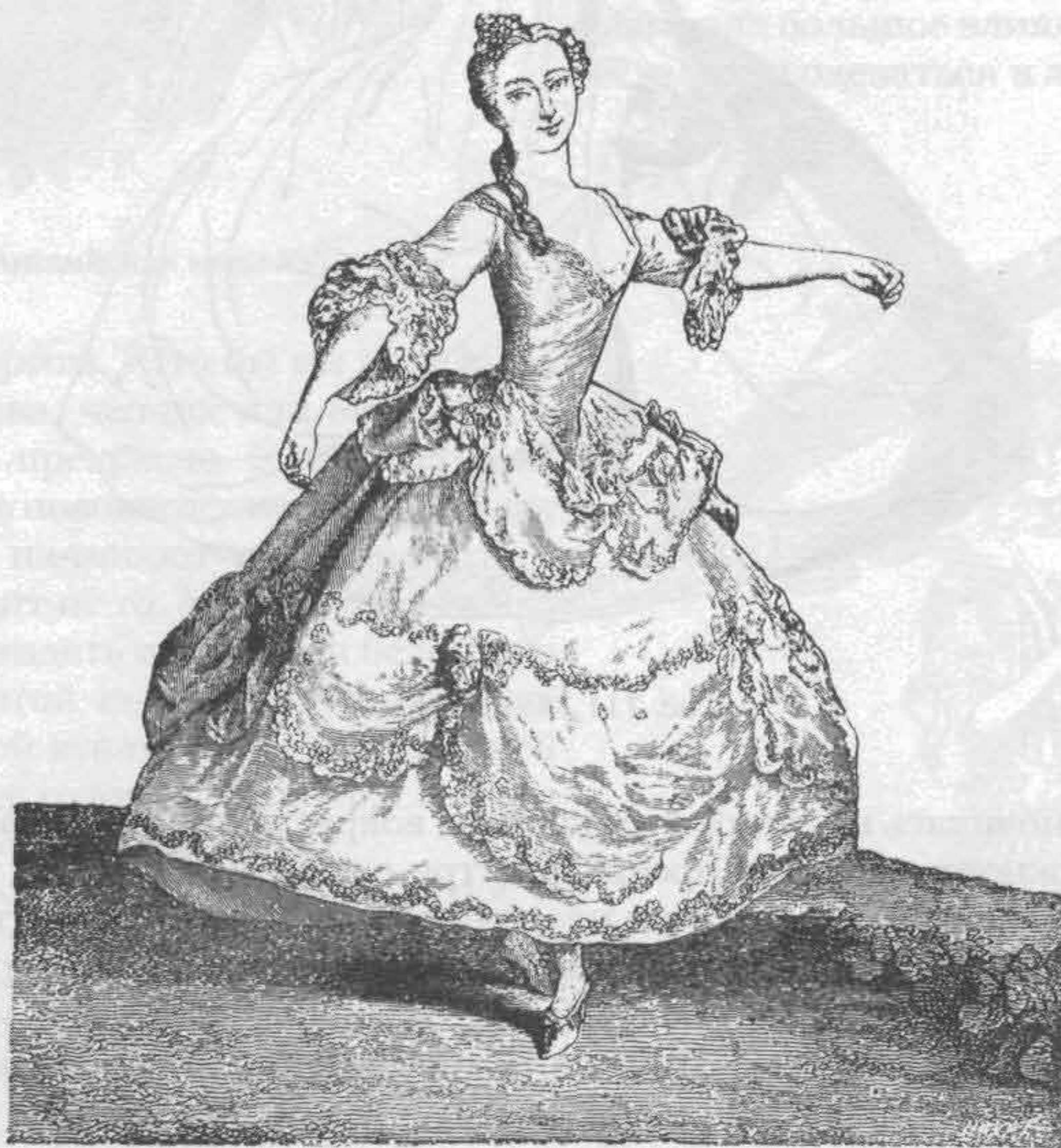
Рис. 712. Мода 1740 г.

Особое место заняли в одежде так называемые прорезы. Одежания в обтяжку не нравились ни германской молодежи, ни военным. Свободу движений могли обеспечить только прорезы. Впервые прорез появился на локтевом, плечевом и коленном сгибах. Их подшивали снизу другой материей, хотя некоторые ландскнехты по бедности или из хвастовства выставляли напоказ свои голени.