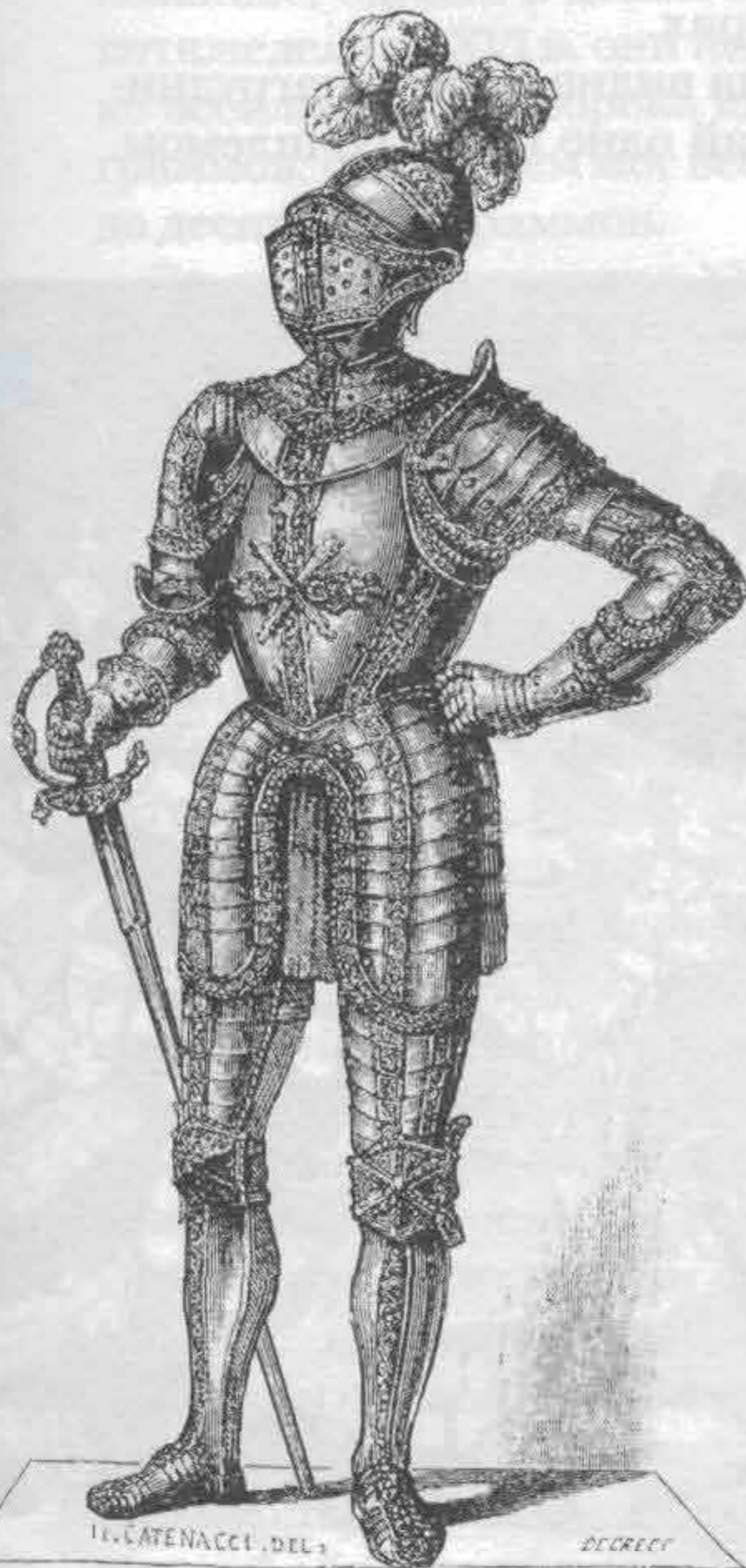
Рис. 720. Средневековое рыцарское вооружение