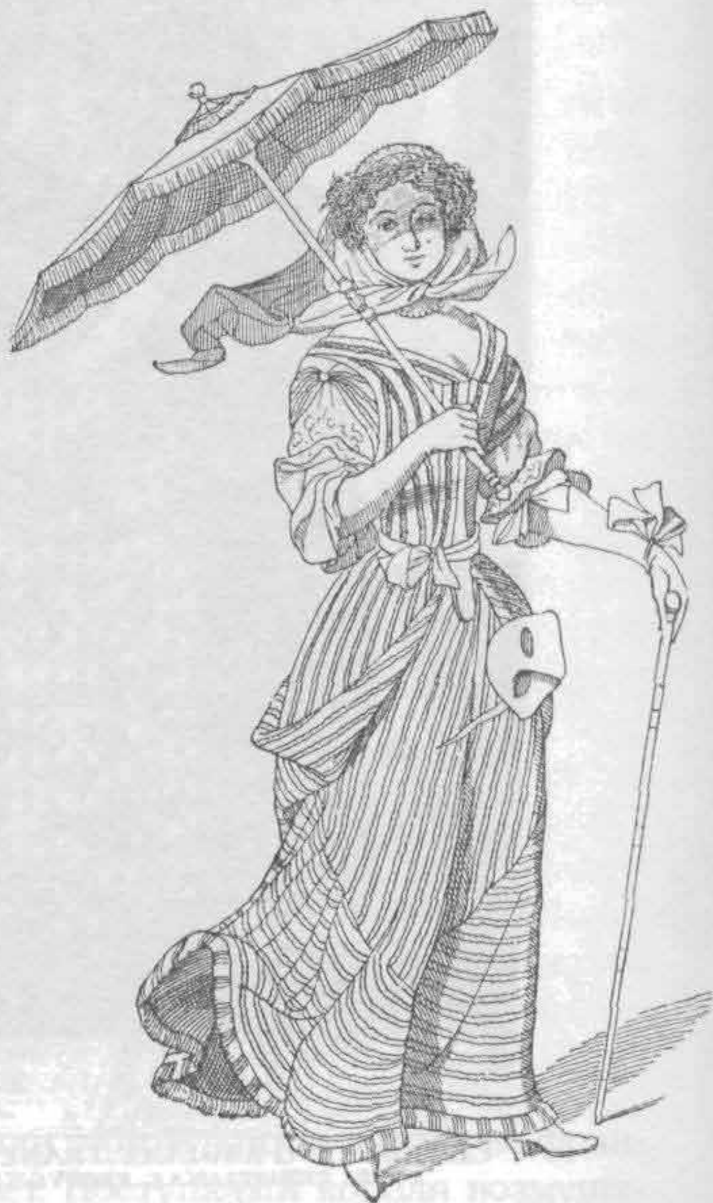
Рис. 710. Французский костюм 1680—1690 гг.

Королева Маргарита (1589—1615) оказывала большое влияние на моду; о ее умении одеваться к лицу говори-