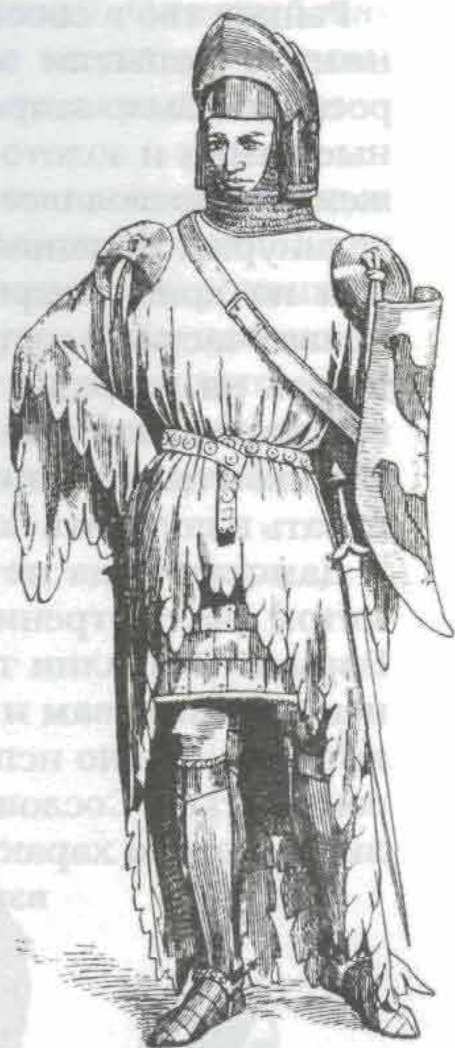
Рис. 697. Французский рыцарь (XIII в.)

Бернский городской совет в 1470 г. даже издал постановление для низших классов общества, которое, в частности, гласило: «Отныне ни одна женщина не должна носить хвостов у юбок длиннее, чем у ее домашних платьев. Золото, серебро и драгоценные камни имеют право носить только лица благородного происхождения; им воспрещается носить горностаи и куницу, чтобы сохранить различие между сословиями и в корне уничтожить тщеславие».