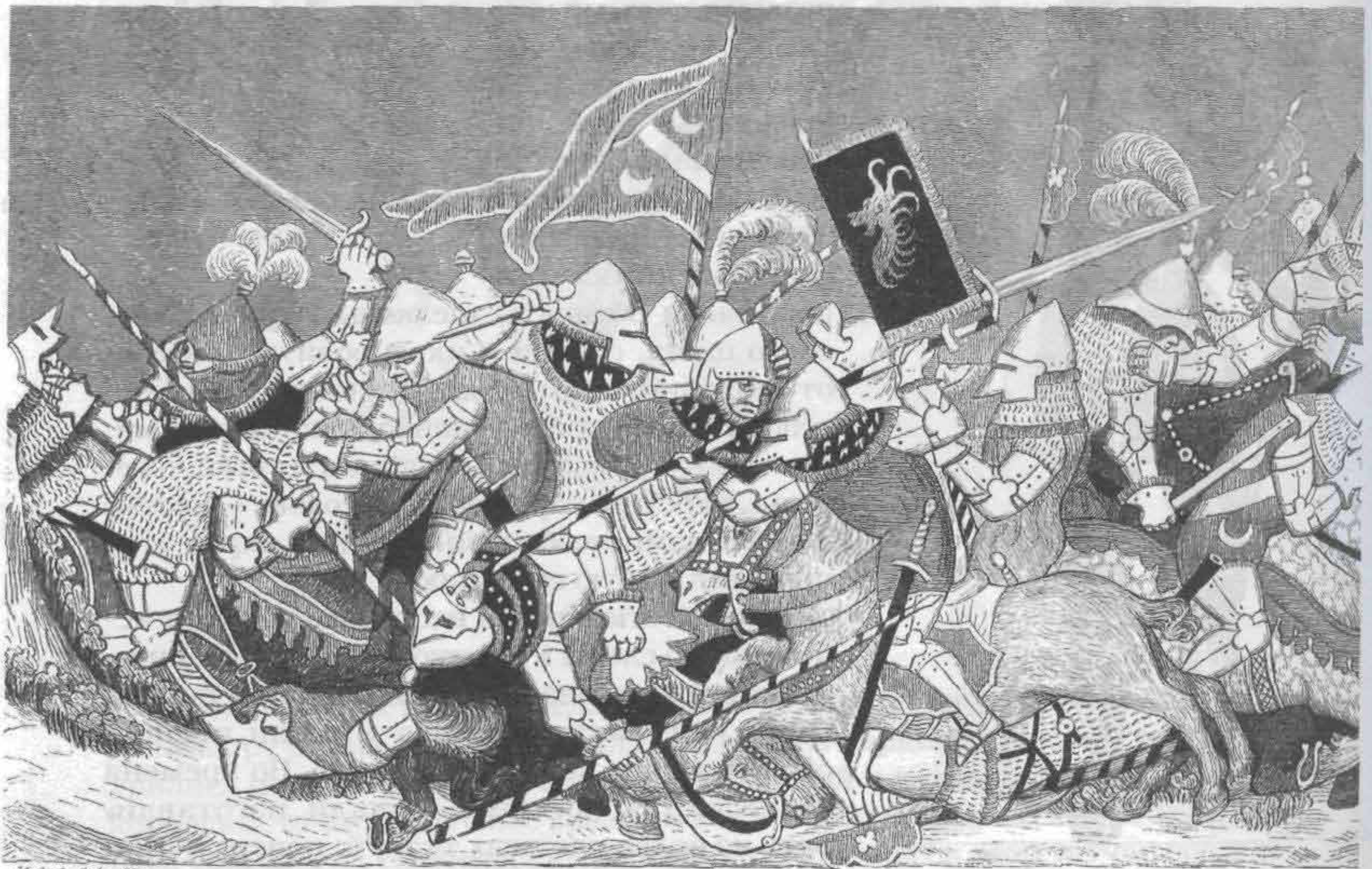
Рис. 721. Рыцарское вооружение XIV в. Битва при Земпах. Фрагмент миниатюры 1385 г.

Для защиты затылка и шеи в том месте, где она видна поверх нагрудника, существовал нашейник, иногда составлявший одно целое со шлемом.