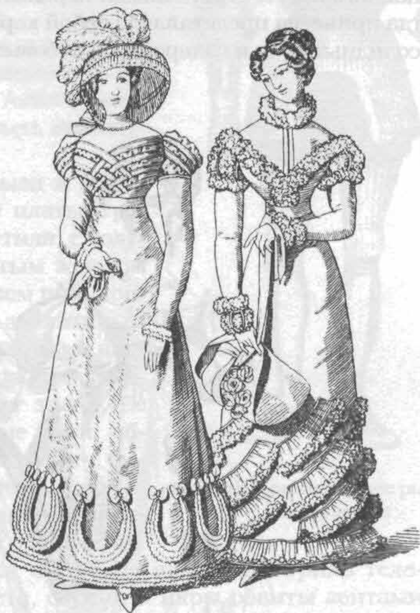
Рис. 716. Мода 1821 г.

Еще большим изменениям подвергся французский женский костюм. Фижмы, которые француженки надели в начале XVIII в., подражая англичанкам, вскоре увеличились до двух метров в диаметре. Сами юбки шили из туго накрахмаленного полотна, а затем укладывали на каркас особой конструкции из тростниковых и стальных обручей и распорок из китового уса. Потребление китового уса возросло настолько, что в 1722 г. Нидерланды назначили субсидию в шестьсот тысяч флоринов обществу китоловов. Торговля усом становилась прибыльнее с каждым днем. Духовенство от таких затей приходило в ужас; аббаты не только произносили с амвона про-