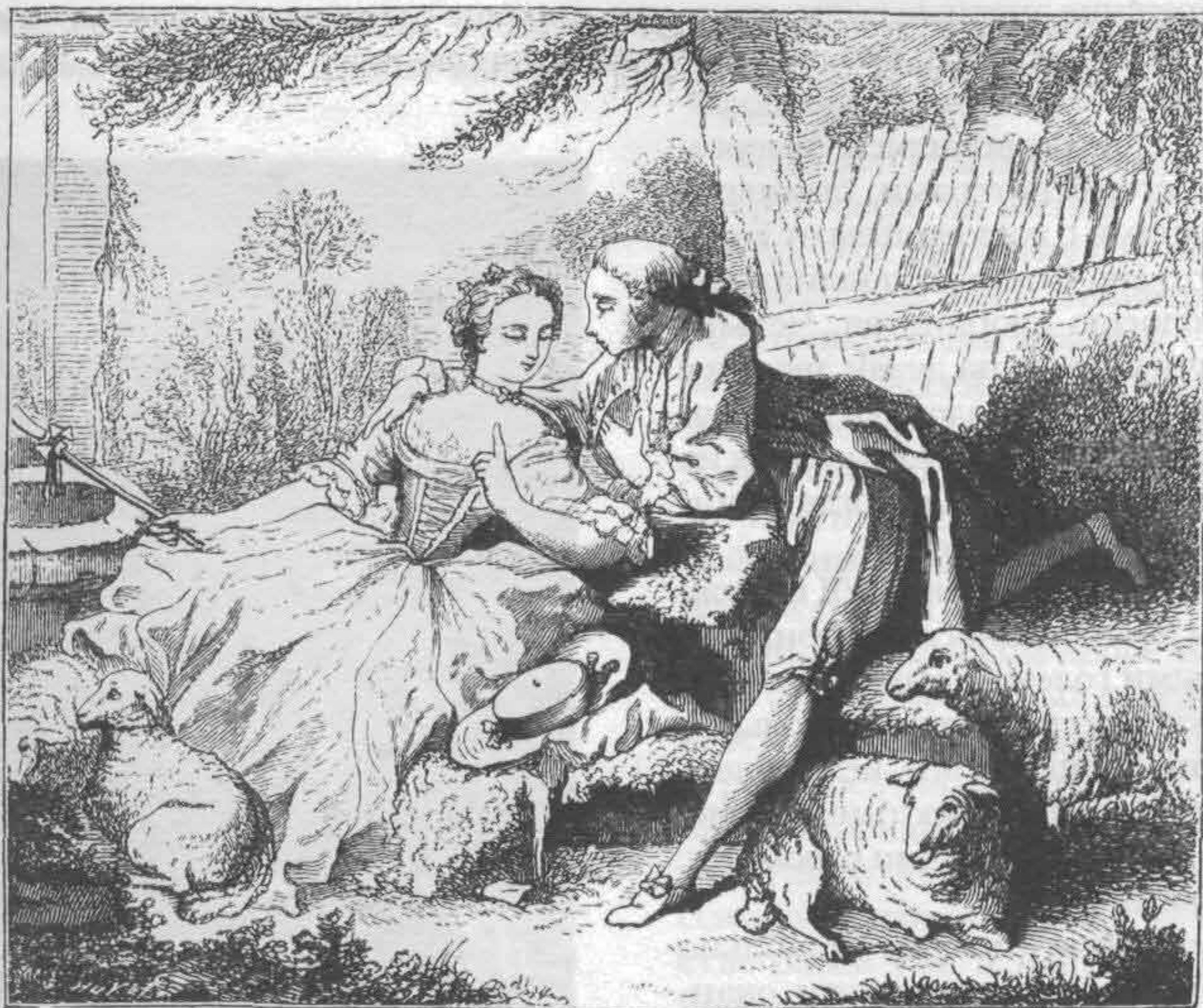
Рис. 713. Французский костюм 1740 г.

Германские дамы сосредоточили свое внимание на лифе и, главным образом, на рукавах. Открытое декольте, занесенное из Франции, здесь продержалось недолго; вскоре даже молодые женщины стали закрывать грудь до самой шеи.