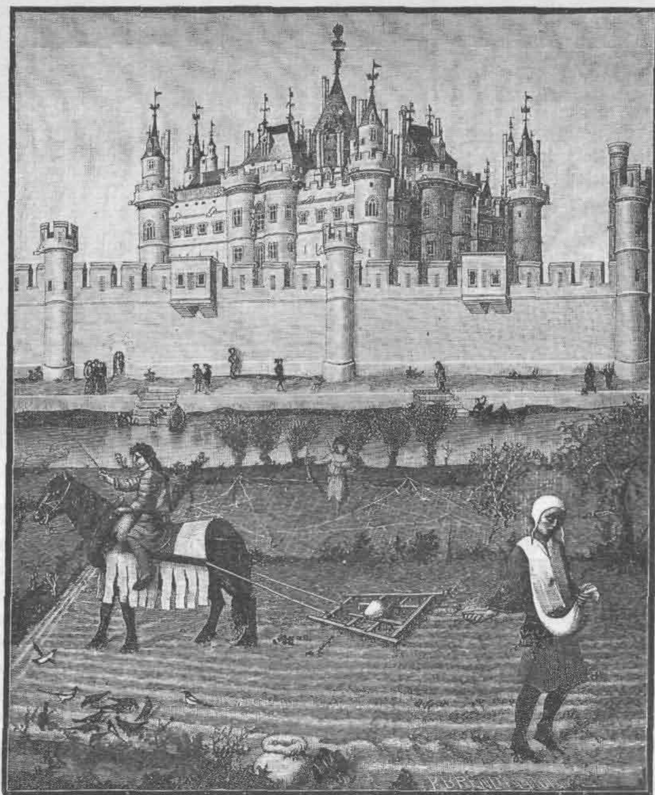
Рис. 724. Одежда мирных жителей. Посевные работы близ замка. Миниатюра из «Livres d'heures» герцога Берри

Одежда войск стала проще только в XIX в. Уже Наполеон в своем походном сюртуке являлся образцом простоты. Впоследствии стали обращать внимание еще и на легкость военной формы.