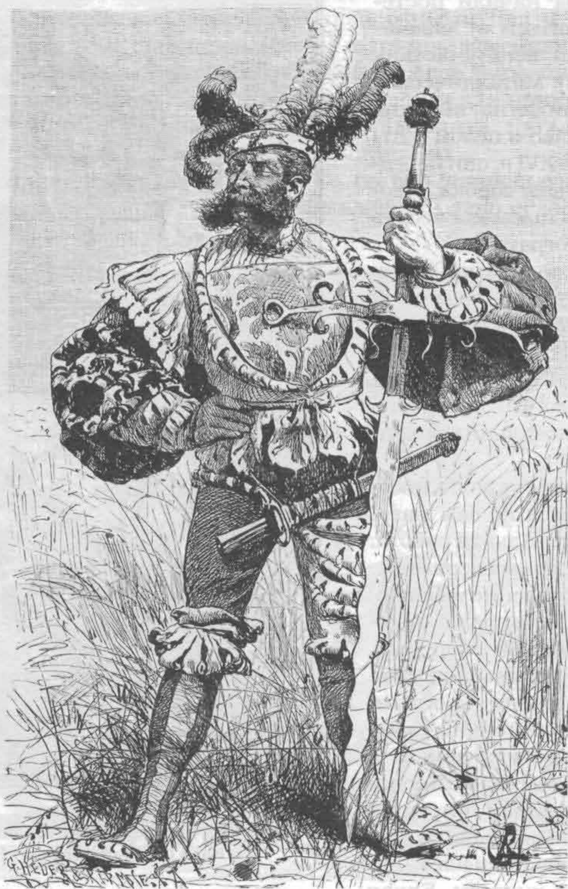
Рис. 723. Ландскнехт в полном вооружении

Поверх панциря всегда надевали цветную безрукавку, т. н. супервест, расшитый гербами, эмблемами и др. По супервесту отличали полководцев и солдат своей или чуждой армии, так как железные латы были, в общем, похожи друг на друга. Кроме того, супервест уменьшал накаливание лат на солнце и охлаждение на морозе.