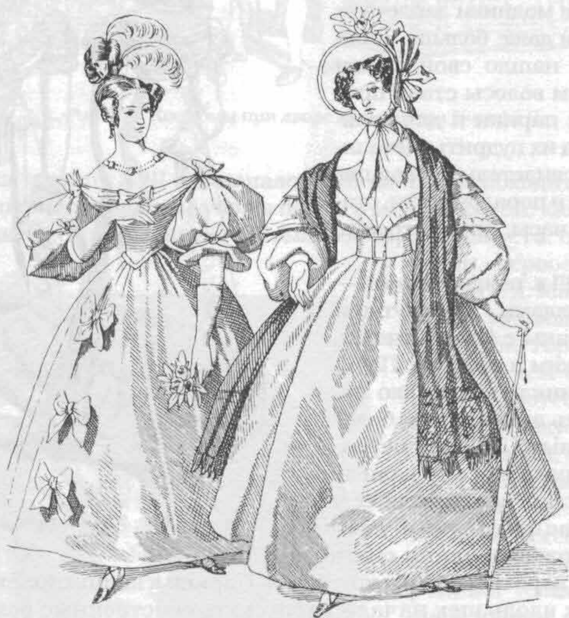
Рис. 718. Моды 1830 г.

Прически превзошли все, что было изобретено человечеством конца XVIII века. Парикмахер маркизы де Помпадур имел двести тысяч ливров годового дохода. Прически, вначале поднявшиеся на тридцать сантиметров, доросли наконец до того, что стали в восемь раз больше головы. Чтобы удержать волосы на этой высоте, их собирали в подушки и укрепляли проволокой и китовым усом. Приготовленную искусным парикмахером копну волос украшали павлиньими и страусиными перьями, шнурами, жемчугом и цветами. Иногда прическа представляла собой корзинку, полную цветов или фруктов, или солидный куст из лавровых и дубовых ветвей.