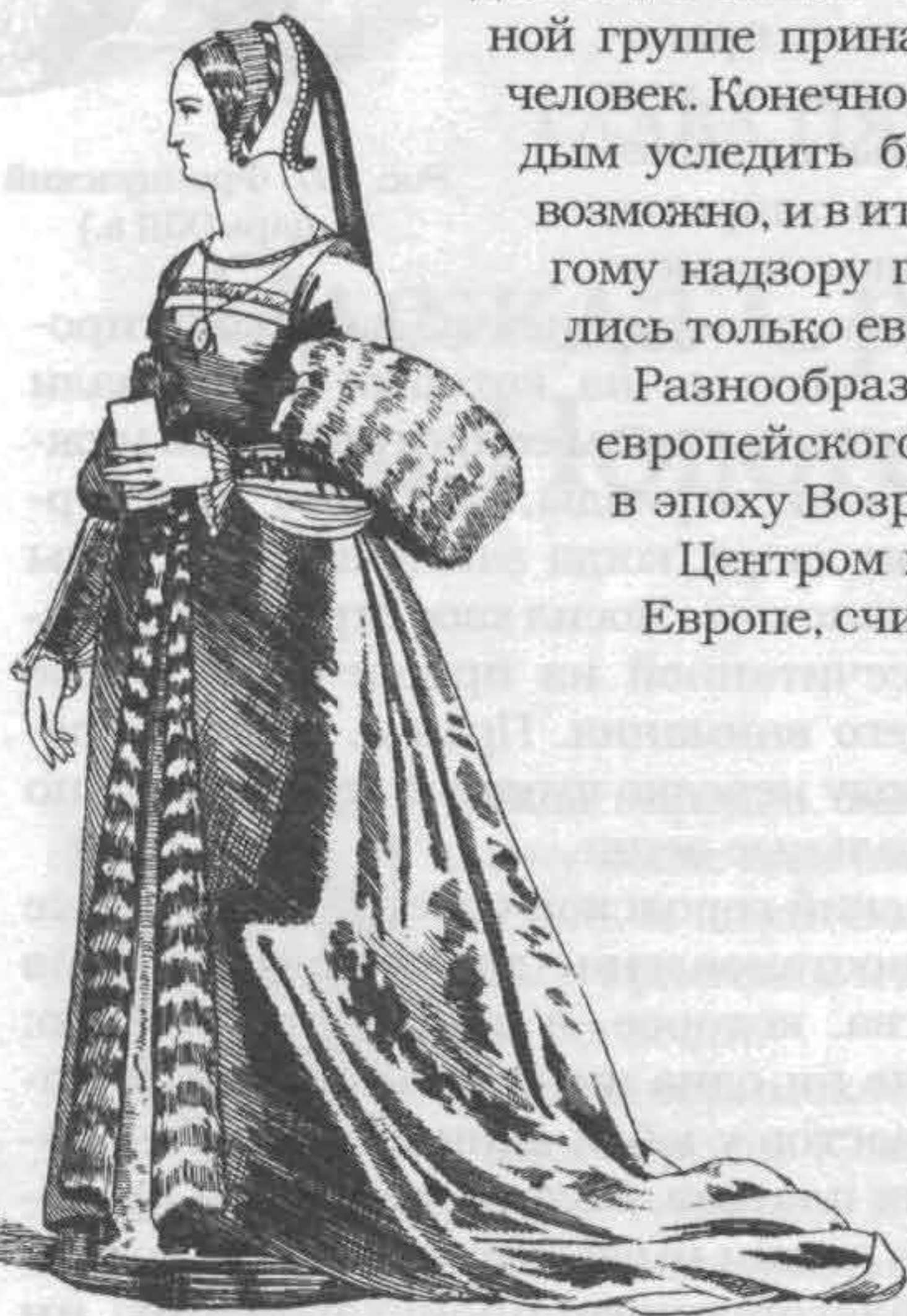
Рис. 700. Придворная дама при дворе Франциска I