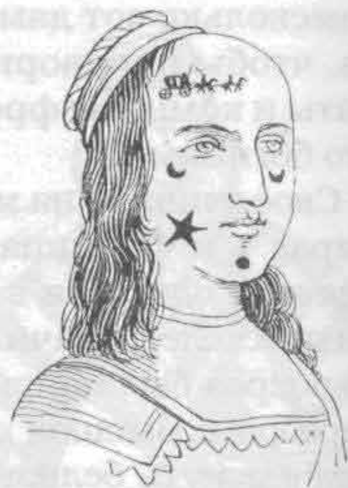
Рис. 702. Мушки 1658 г.: звезды, полумесяцы, кареты и пр.

На голову мужчины надевали женский ток, румянились, носили серьги и небольшие усики; впереди камзола делали вырезанный мыс, стягивали, насколько удавалось, талию; руки и ноги должны были быть по возможности маленькими. Мелко плоенные воротнички были до того огромны и так плотно охватывали шеи, что головы казались лежащими на блюде. Герцог Сюлли рассказывает, что в числе подробностей туалета короля видел висевшую у не-