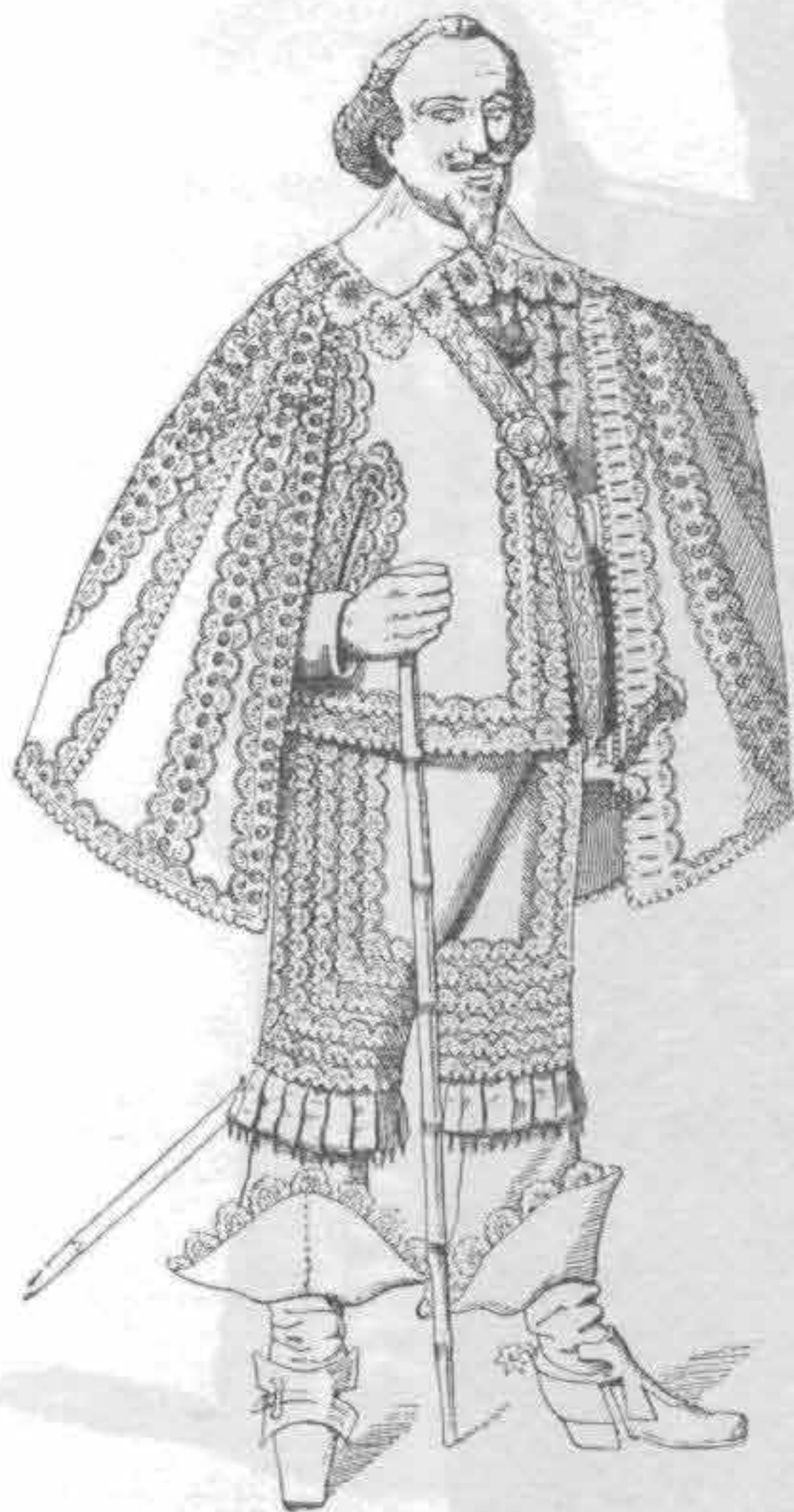
Рис. 703. Герцог Брауншвейгский (1635 г.)