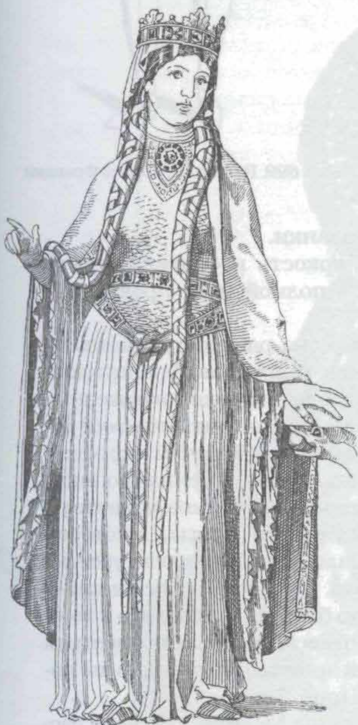
Рис. 698. Женская одежда во Франции (XII в.)