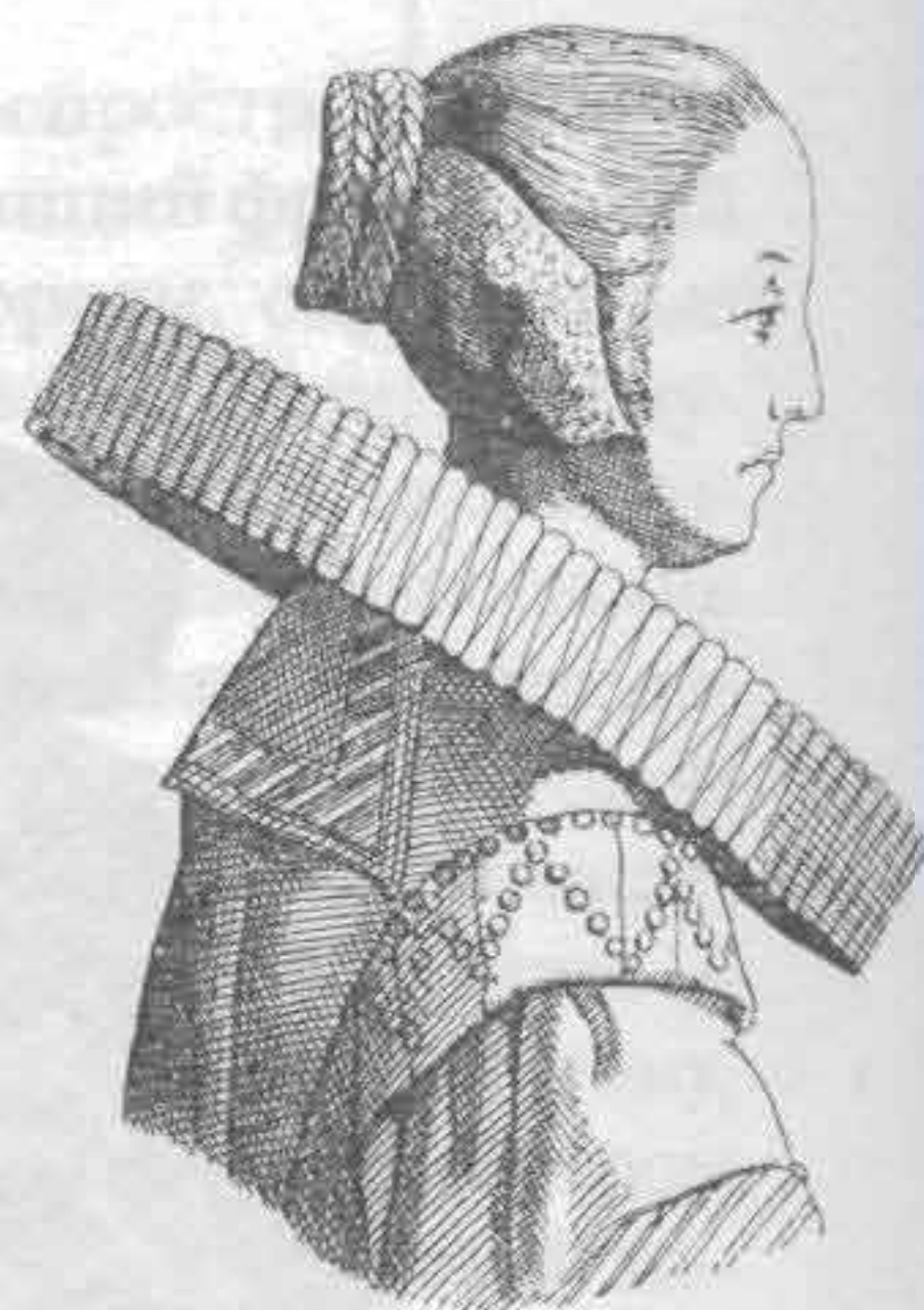
Рис. 704. Женский воротник. Середина XVII в.