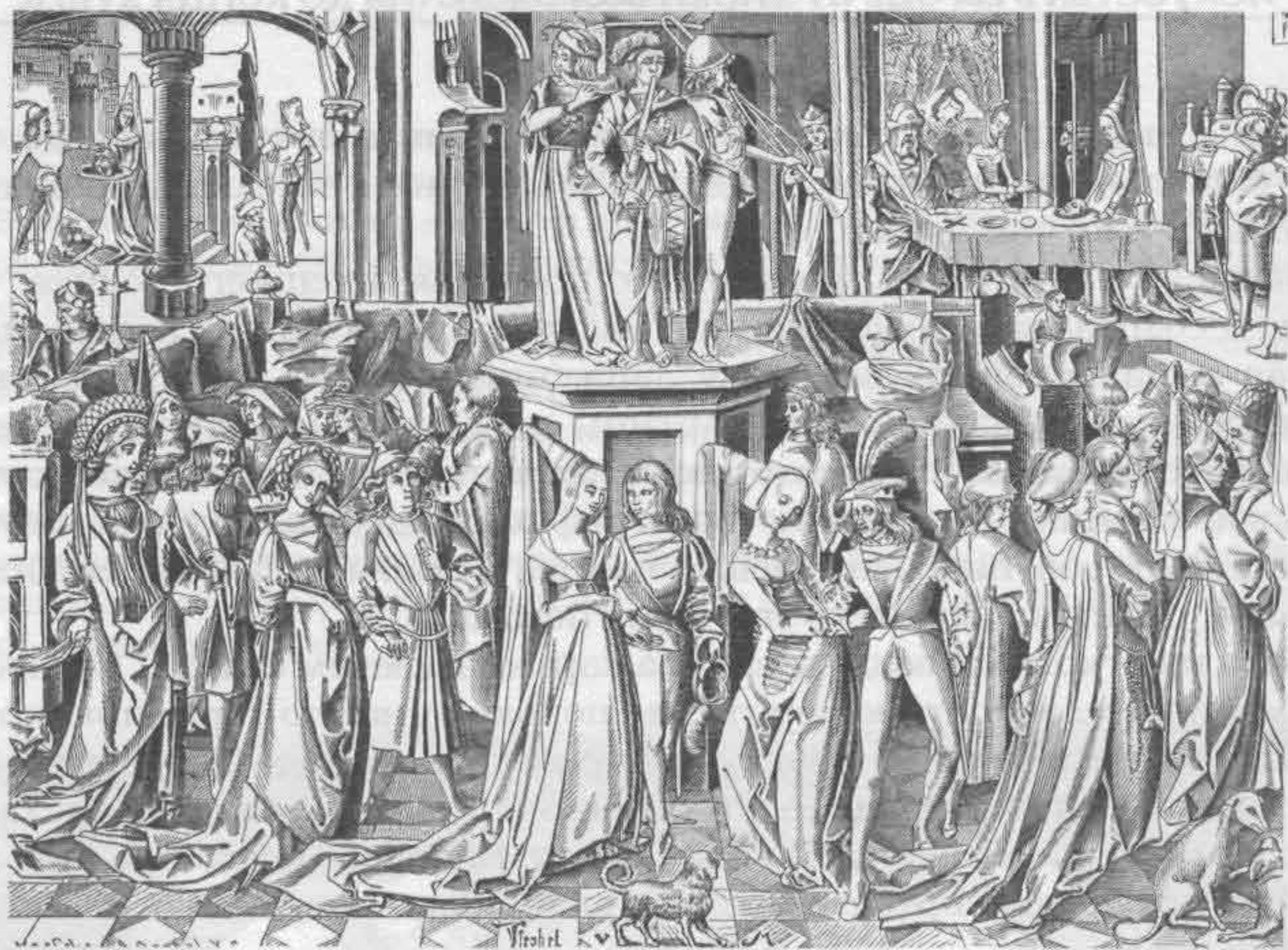
Рис. 696. Костюмы XV в. Праздник у Ирода; на заднем плане отрубают голову Иоанну