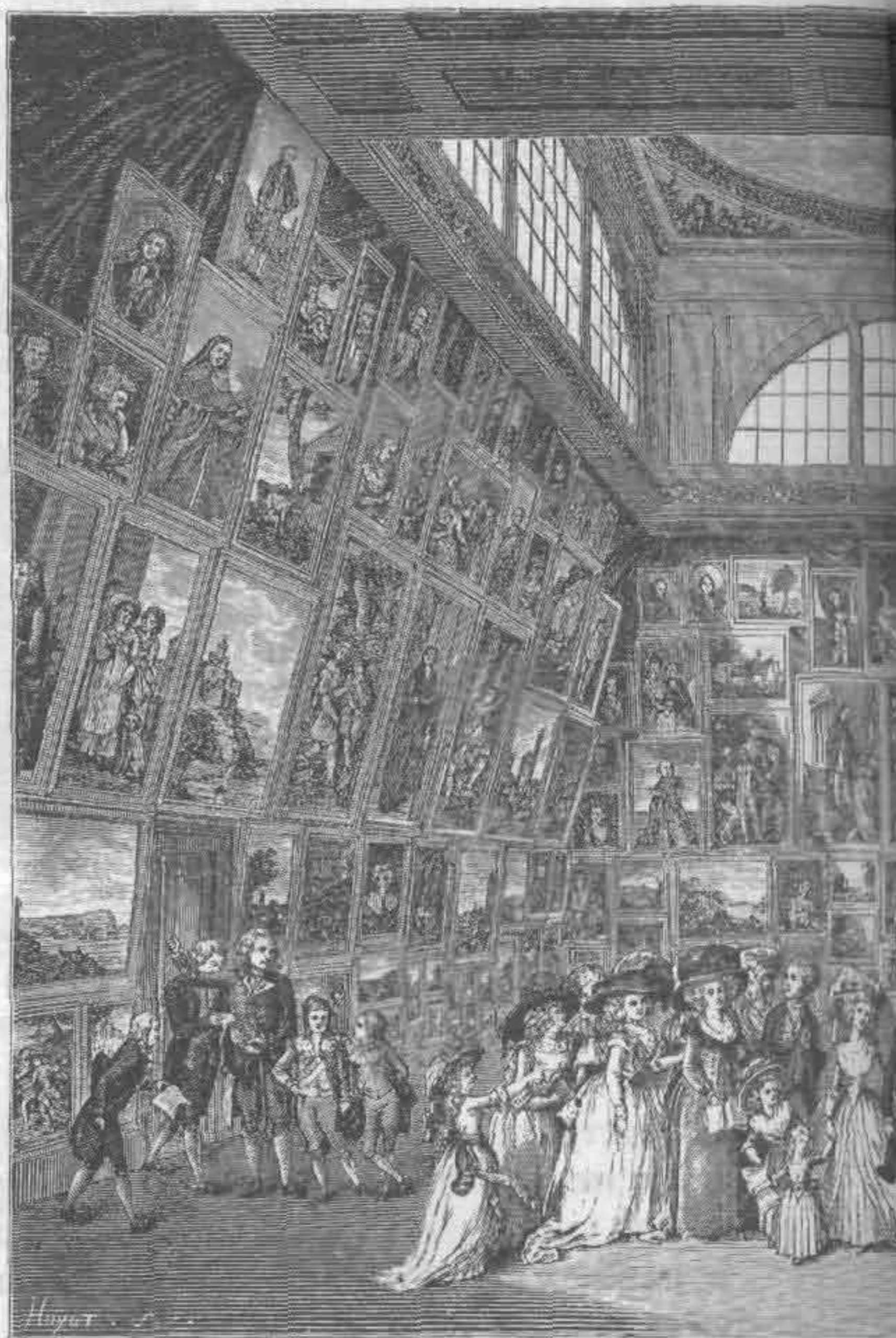
Рис. 717. Одежды Выставка картин в Короле

Собственно говоря, платьев было два: верхнее, расходившееся спереди, и нижнее, видимое из-под верхнего, всегда разных цветов. У некоторых дам и мужчин были видны цветные розетки из лент, так называемые favours . Место расположения розетки символизировало настроение носившего: mignon носили у сердца, asassin — на шее и пр.