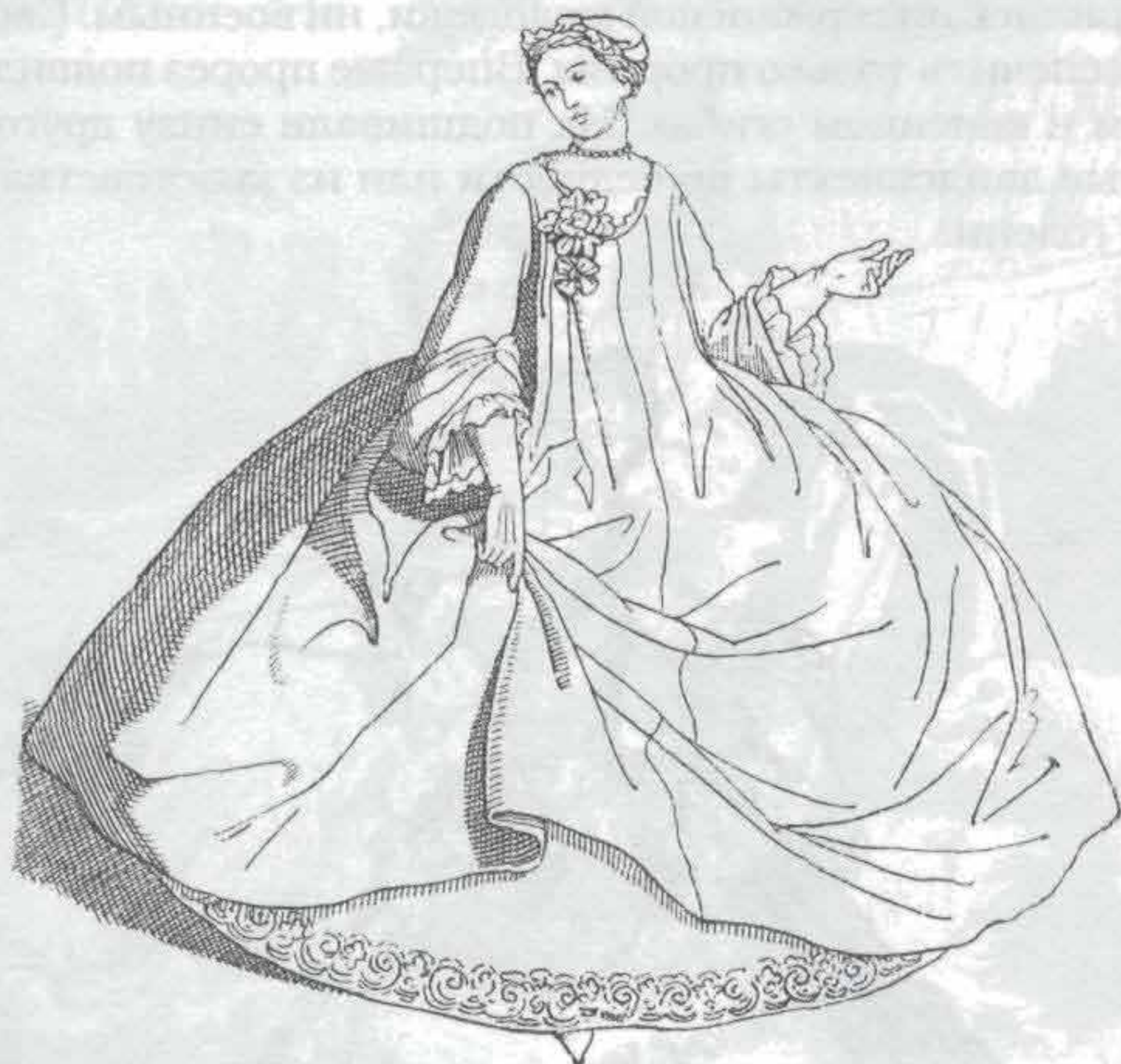
Рис. 711. Мода 1730 г.

Царствование Генриха IV увеличило спрос на разнообразие в одежде, и некоторые части туалета приобрели утрированный вид. Вырез лифа доходил до пояса, поэтому приходилось подшивать нагрудник из тонкой, расшитой прорезью материи. Обнажение плеч вскоре приняло такие размеры, что в 1591 г. папа Иннокентий IX своей буллой предписал дамам прикрываться непрозрачной материей под страхом отлучения от церкви.