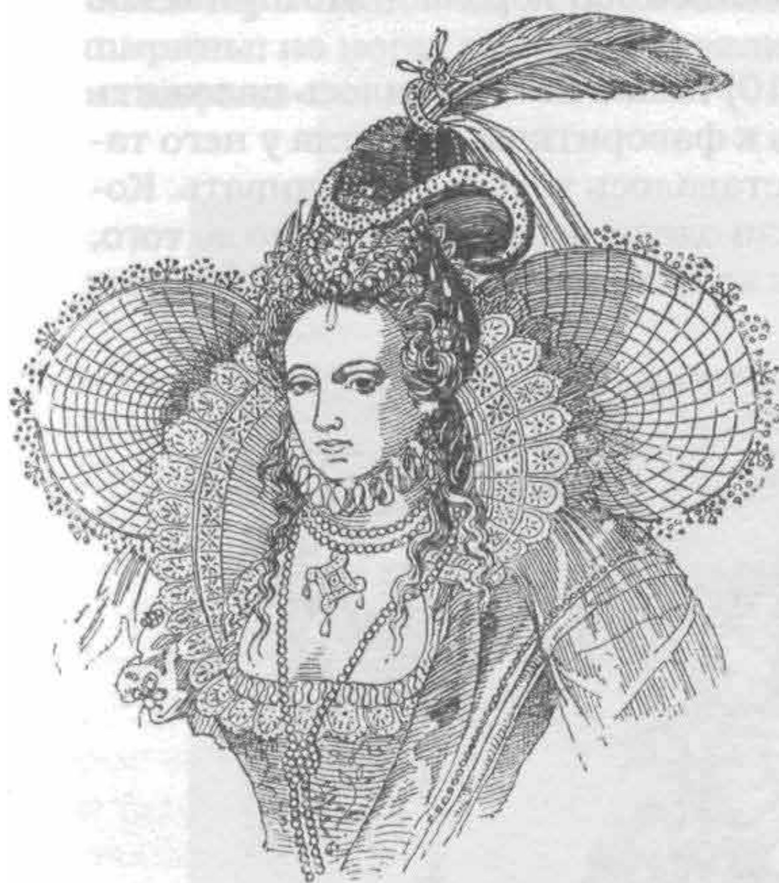
Рис. 709. Английская мода XVI в.

ли с восторгом. «Что бы ни надела наша королева, чепчик или вуаль, — она одинаково прекрасна. У нее всегда какое-нибудь нововведение, но, когда другие дамы начинают ей подражать, у них выходит не то. Мне нередко приходилось ее видеть в атласном белом платье с золотой вышивкой, в креповой или газовой вуали, небрежно выющейся вокруг ее головки, и прекраснее этого я ничего не знаю.