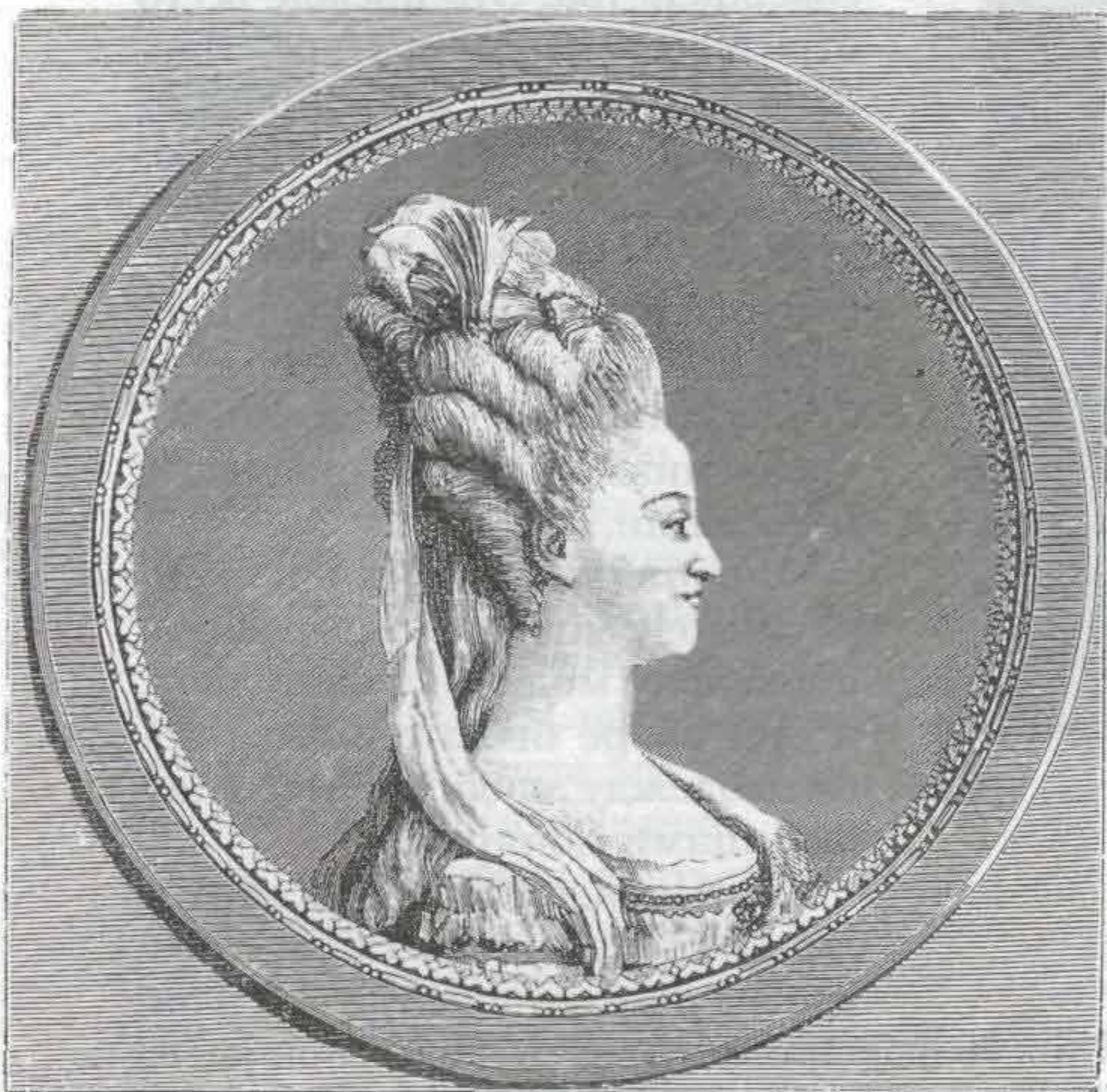
Рис. 715. Прическа Марии-Антуанетты

Франция в XVII и XVIII вв. была законодательницей мод для всего мира (рис. 710—