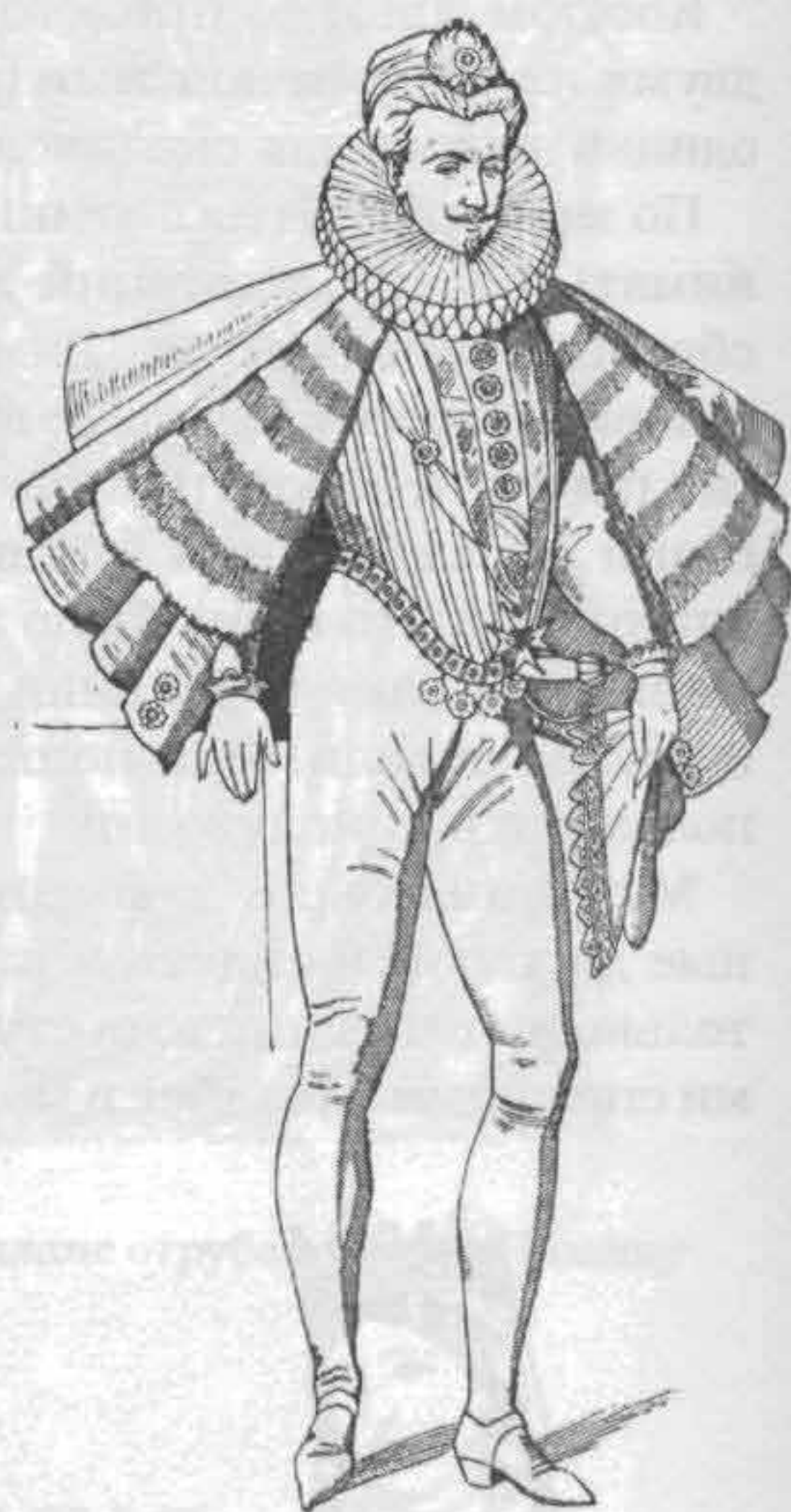
Рис. 699. Генрих III, король Франции

Екатерина Медичи, поощряя распущенность двора, во время своих путешествий окружала себя свитой