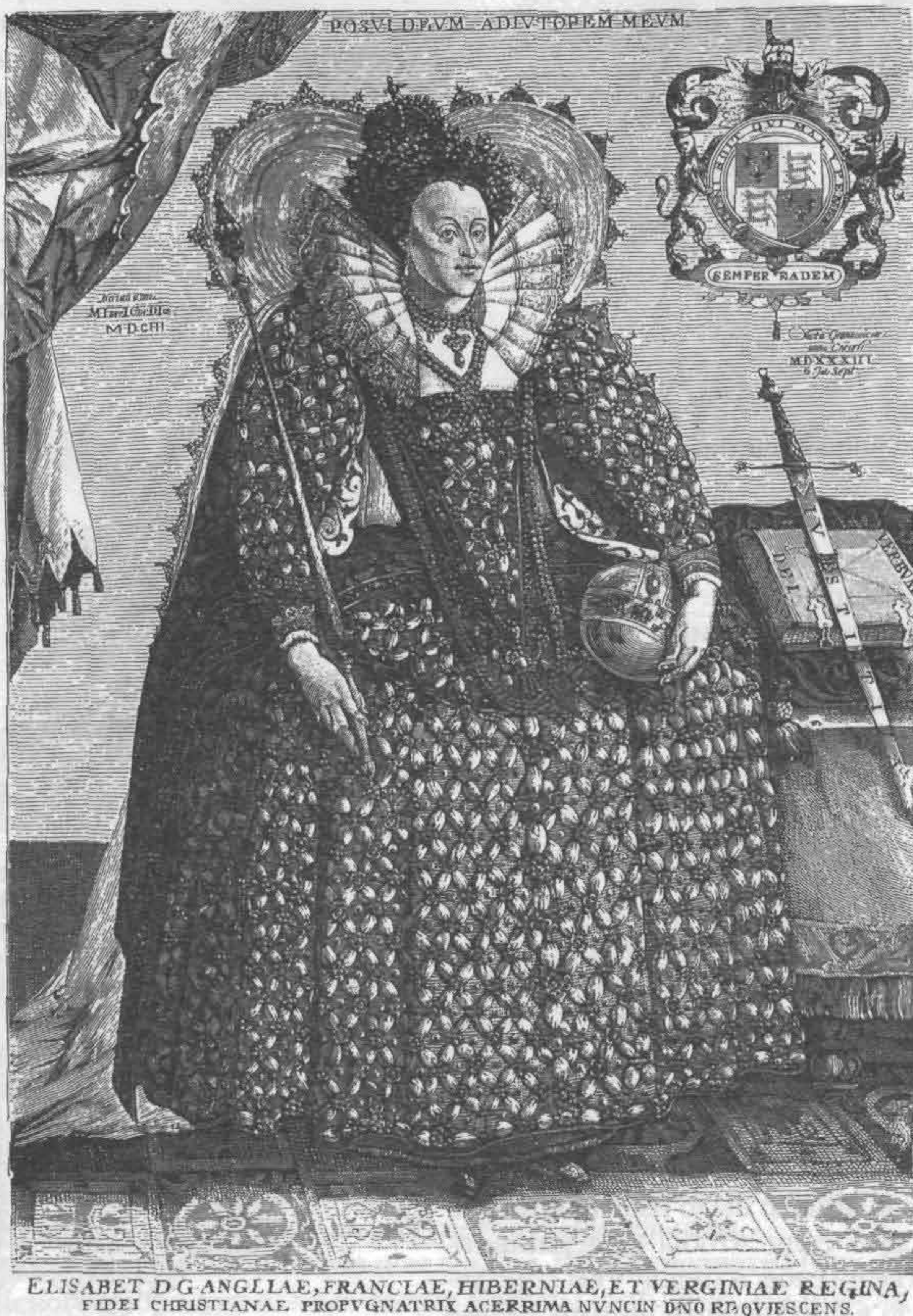
Рис. 708. Королева Елизавета I Английская

У нового короля Генриха IV (1589—1610) также не получилось положить конец придворному распутству. Страсть к фавориткам достигла у него таких размеров, что дворцовые расходы оставалось только увеличивать. Король любил, чтобы близкие ему дамы были одеты роскошно. Дошло до того, что маршал де Бассомпьер заказал себе к крестинам дофина платье из шел-