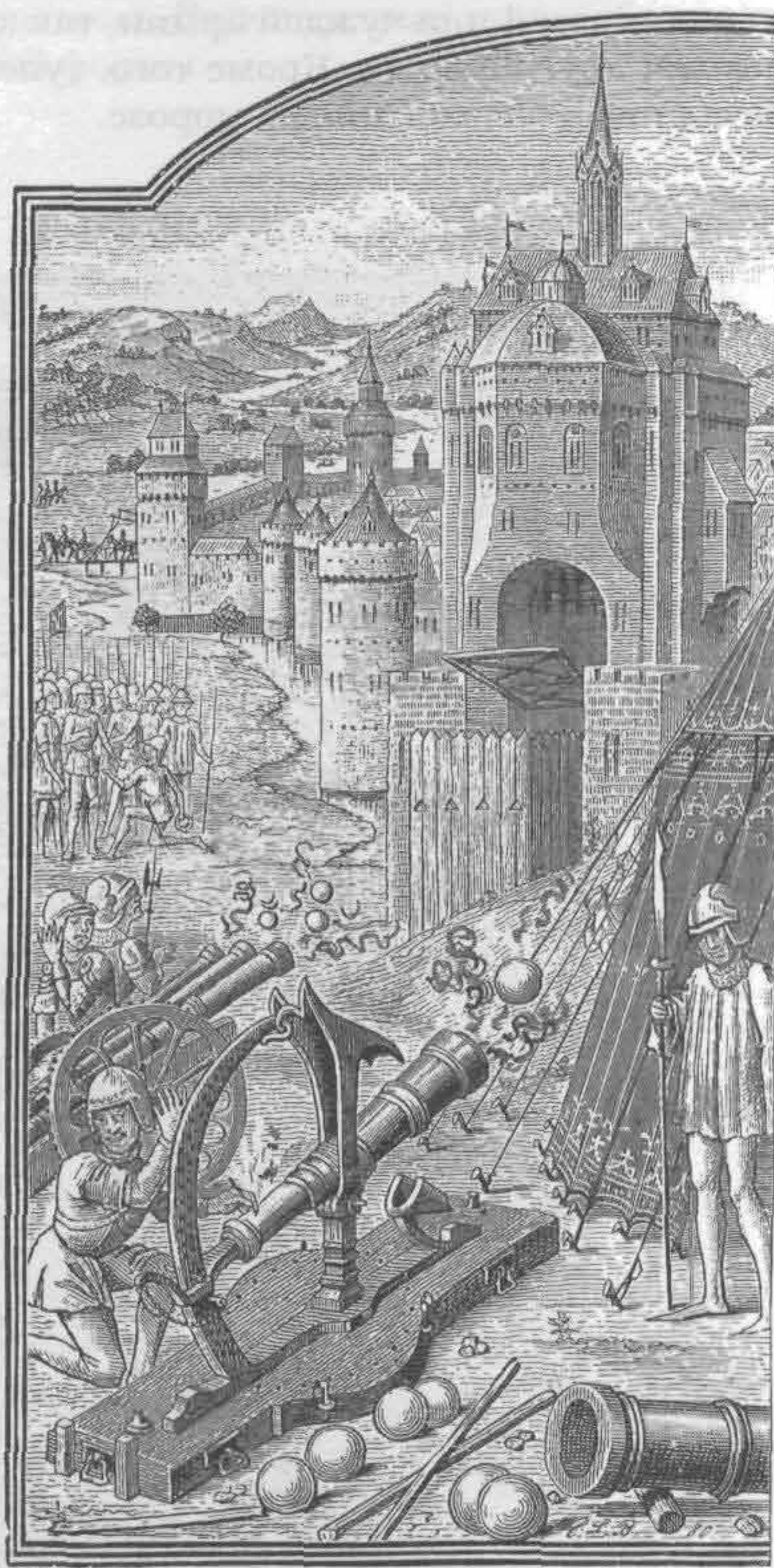
Рис. 722. Средневековые осадные орудия. Карл Смелый осаждает Нейс

Латы и оружие украшали богато, но ценился не сам материал, а гравировальная работа. Альбрехт Дюрер, усовершенствовавший травление гравюр, придал новый импульс художественной обработке оружия. Гравирование при помощи травления было очень простым. Сталь покрывали тонким слоем состава, нечувствительного к кислоте, и по этому слою процарапывали нужный рисунок. Затем рисунок окаймляли воском и в образовавшиеся каналы наливали кислоту. Едкая жидкость вытравливала намеченный рисунок. Если требо-