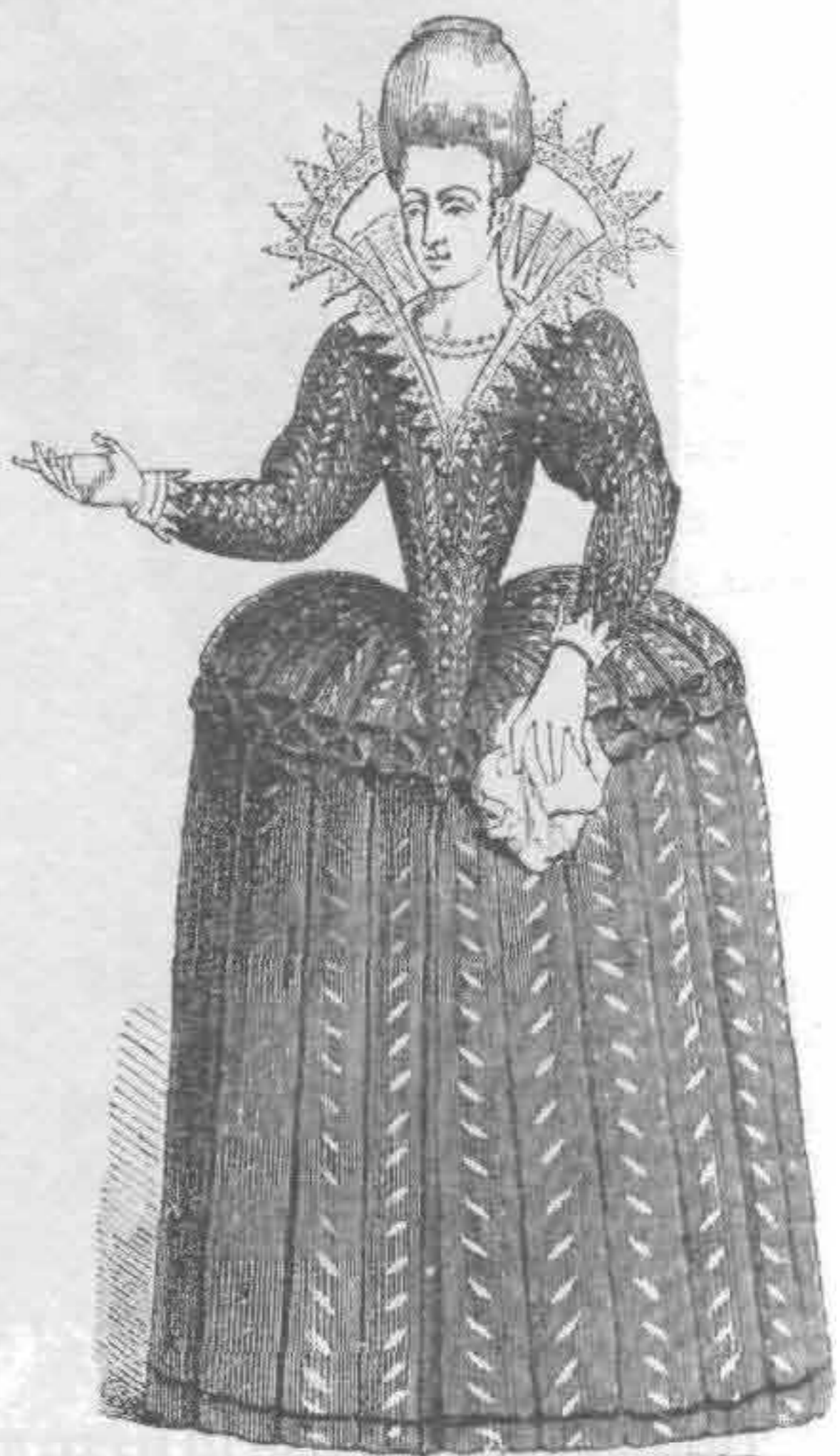
Рис. 706. Французская мода конца XVI в.

А вот как описывали франтов того времени: «На одном камзол совершенно обтяжной, словно к нему приклеен, коротенький, с узенькими рукавами; шляпа с высокой заостренной тульей и крохотными полями. Плащ tabaré далеко волочится по земле. Длинные панталоны во вкусе Марини, по провансальской моде. На другом камзол широчайший, весь в рубцах, подбитый и круглый, сзади похожий