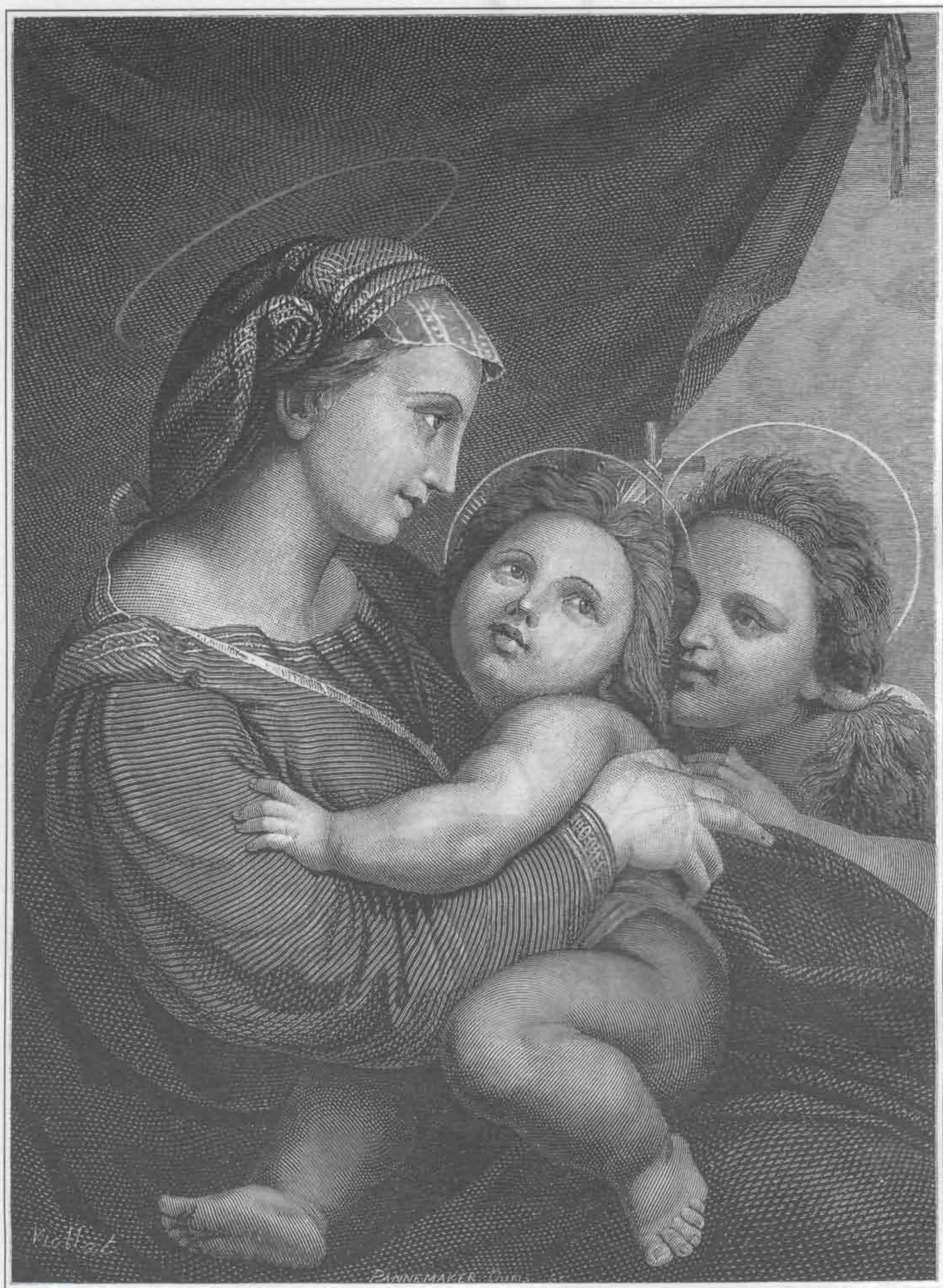
Рафаэль. Мадонна под пологом