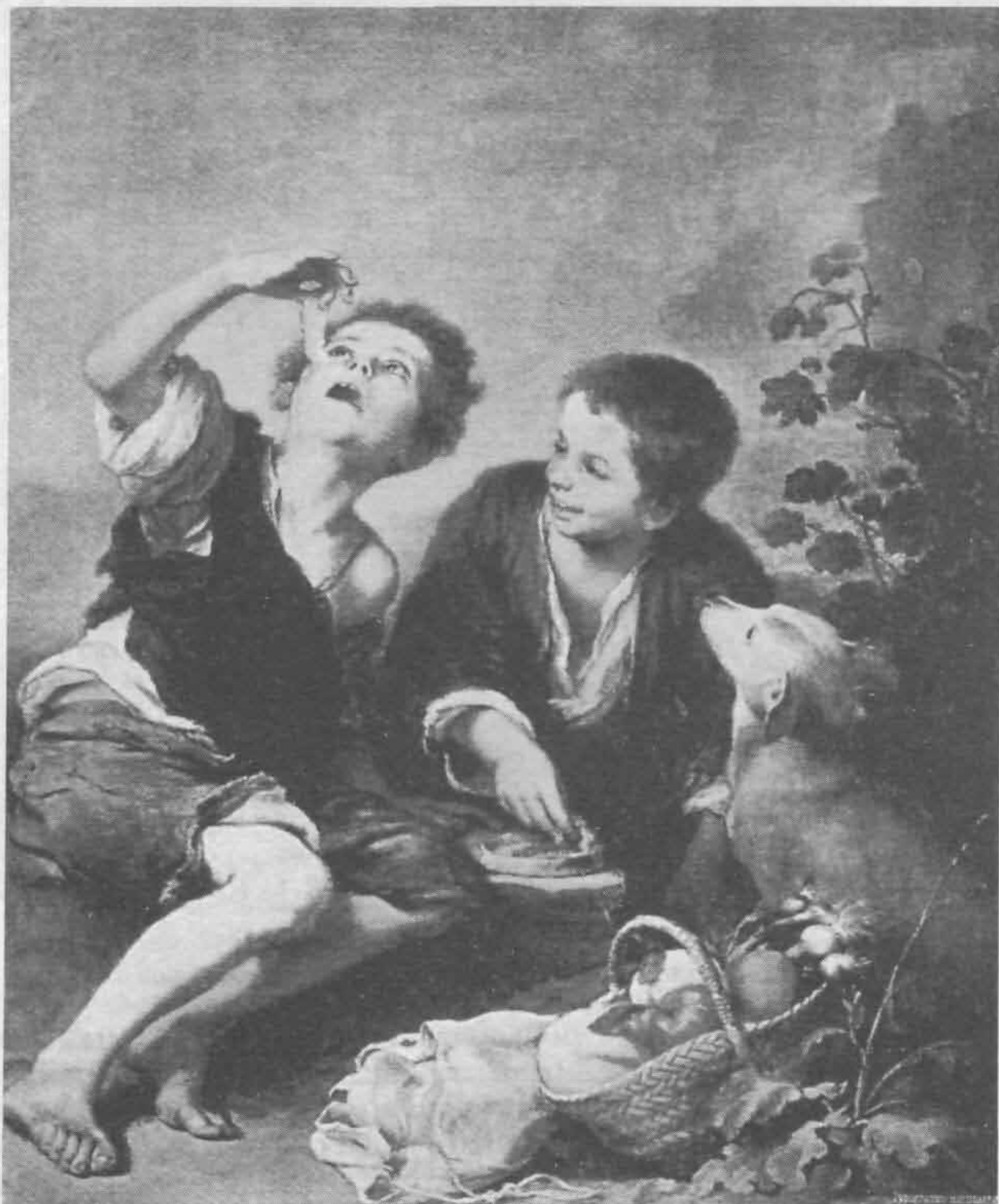
Рис. 542. Бартоломе Эстебан Мурильо. Дыня

Деятельность Мурильо была чрезвычайно разнообразна (рис. 540—542), и он одинаково мастерски писал и библейские сюжеты, и жанры. Энергия и подвижность его характера стали и достоинством, и недостатком худож-