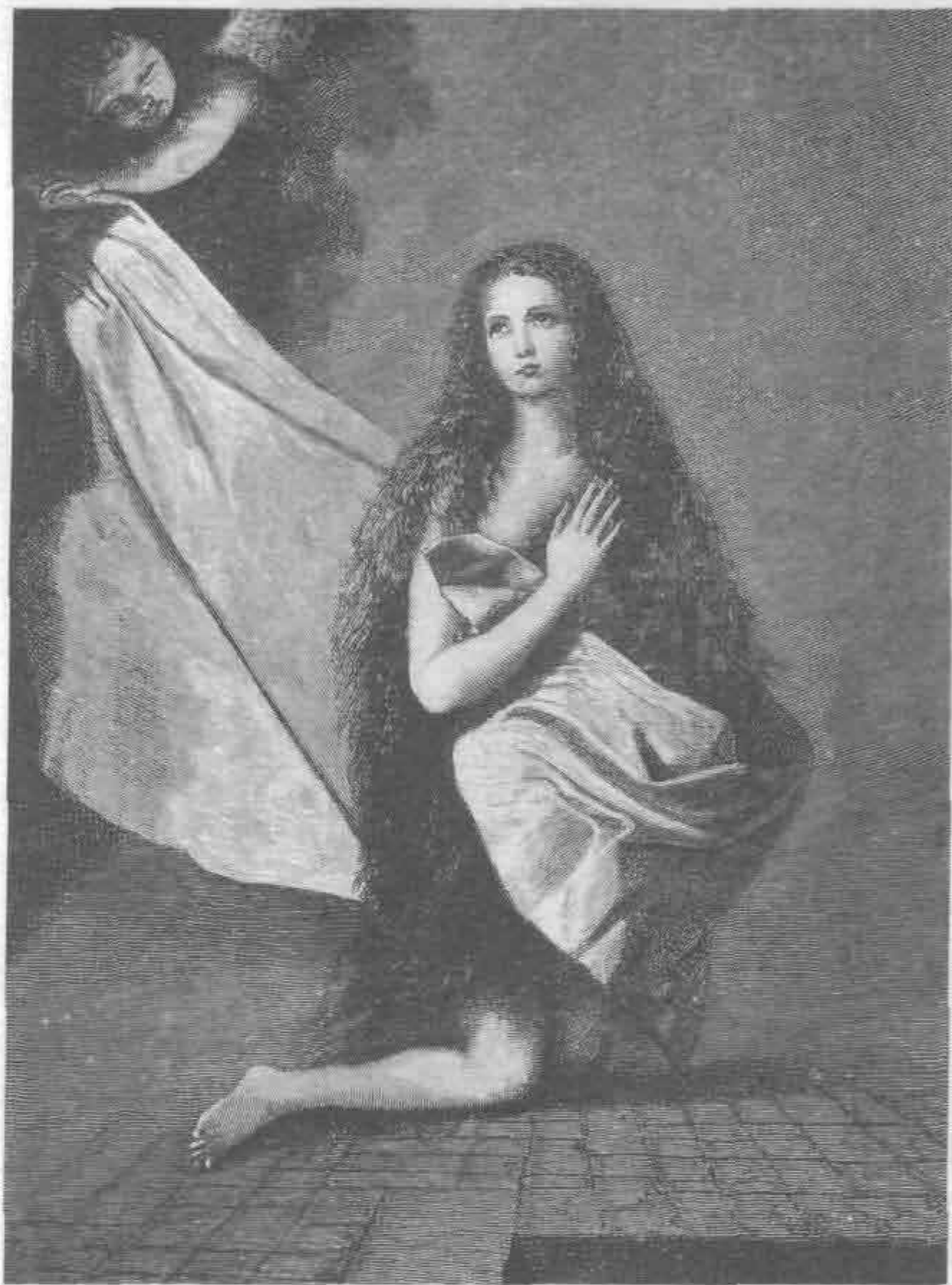
Рис. 535. Хусепе де Рибера. Св. Инесса

Произведения Веласкеса хранятся в разных музеях Европы, и везде они являются украшением картинных галерей. Во всех его работах на первый