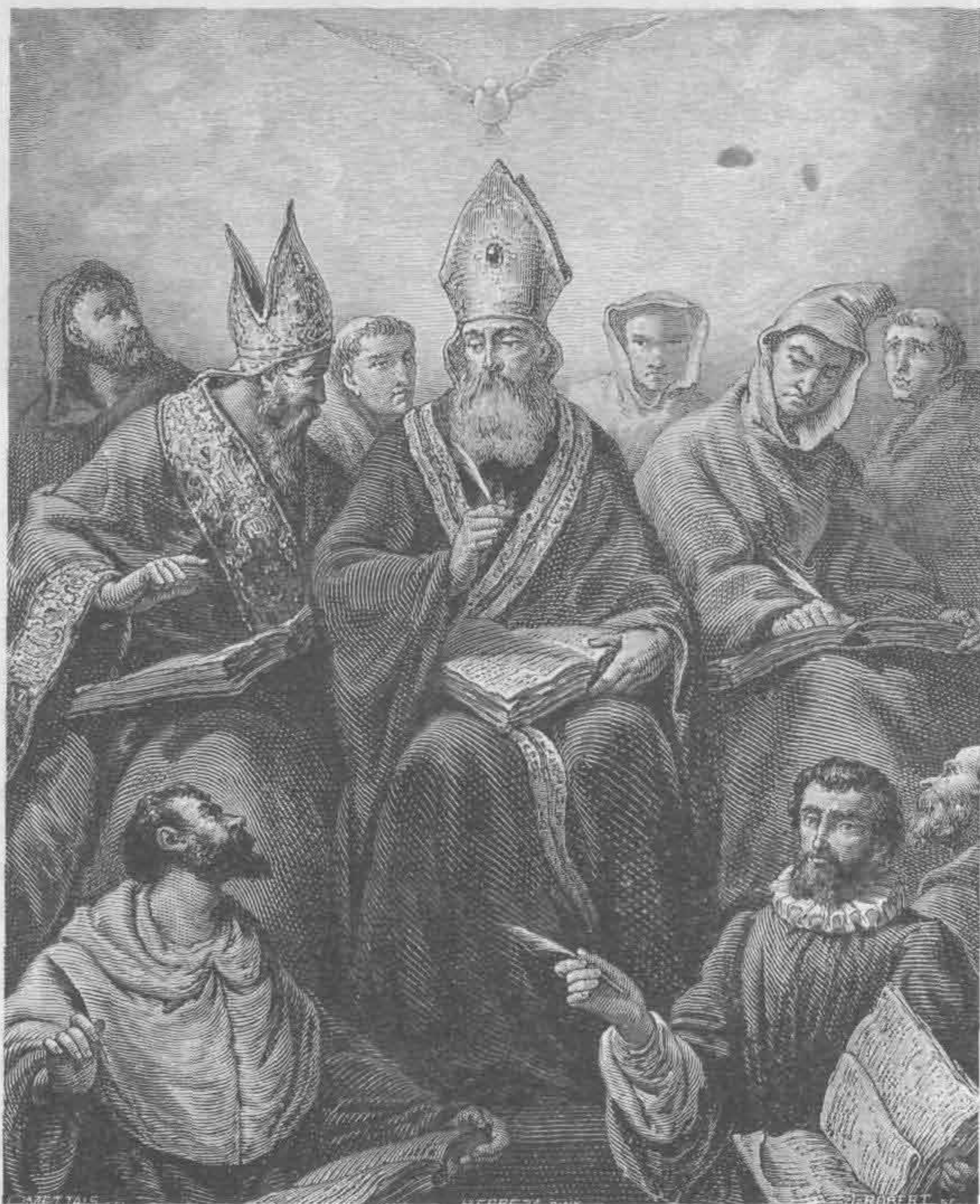
Рис. 532. Франсиско де Херрера эль Виеко. Св. Василий

Конец жизни Риберы был довольно таинственным. Его красавицу дочь Марию Розу похитил Неаполитанский вице-король. Семидесятилетний художник, вооружившись кинжалом, вышел из дома в сопровождении верного слуги. Больше его никто не видел. Был ли он убит или посажен в тюрьму, неизвестно.