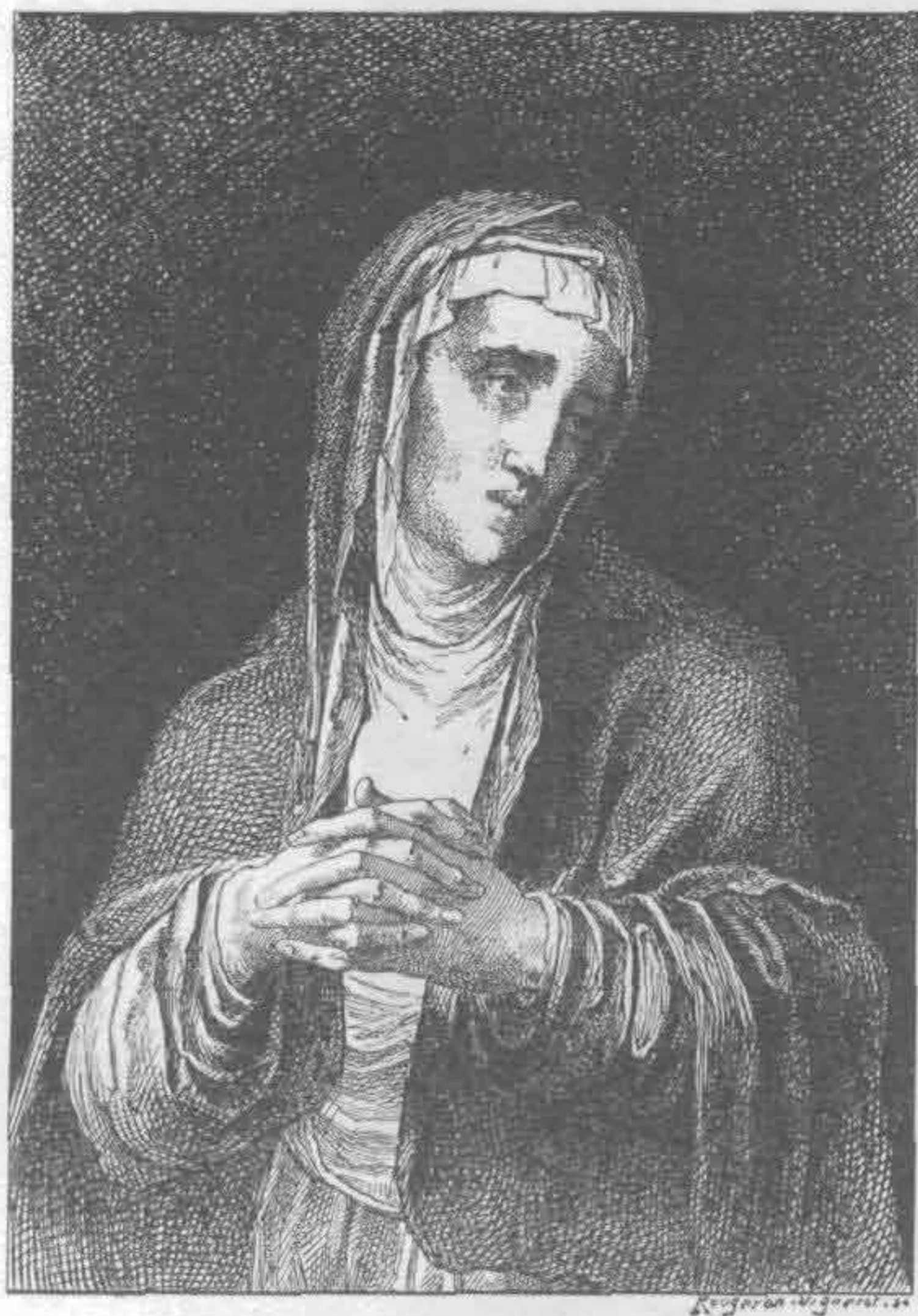
Рис. 530. Луис де Моралес. Скорбящая Богоматерь

ками собор в Толедо и серебряную трапезу мадридского собора. Знаменитыми живописцами были Луис де Моралес, Эль Греко (Доменико Теотокпули), Луис Тристан, Хуан Хоанес, Берругете и др.