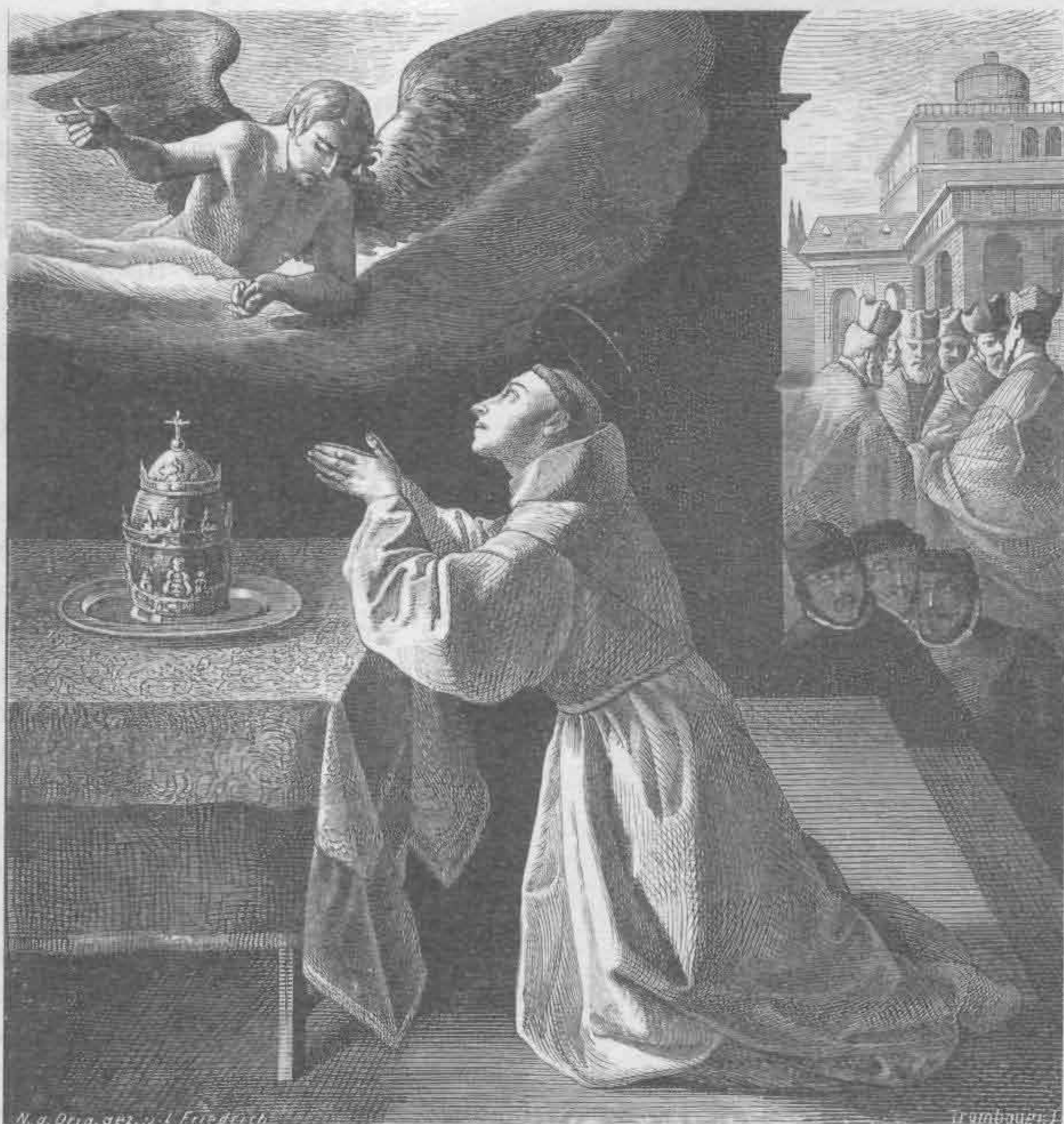
Рис. 536. Франсиско Сурбаран. Святой Бонавентура

В знаменитом «Распятии» Веласкеса игра теней и света соответствует высоте сюжета. Тело Иисуса на ночном фоне неба сверкает матовой серебристостью и благородной кожей, а голова, склоненная вперед со свесившимися на правый бок волосами, осталась в тени.