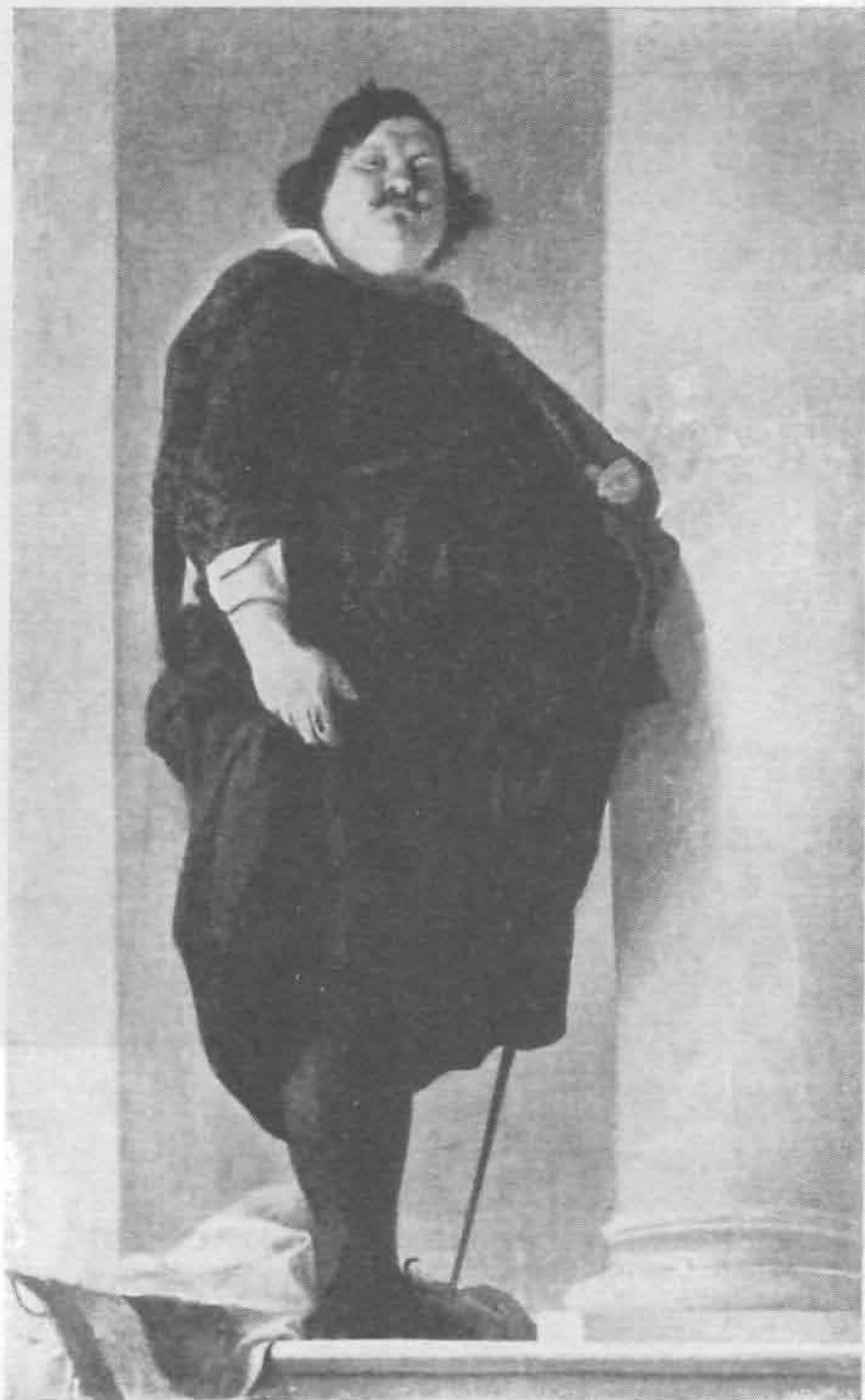
Рис. 537. Диего Веласкес. Портрет маркиза Алессандро дель Борро, начальника итальянской армии при короле Фердинанде III (1649—1651)

Несколько позднее появился другой могучий талант, принесший славу испанской