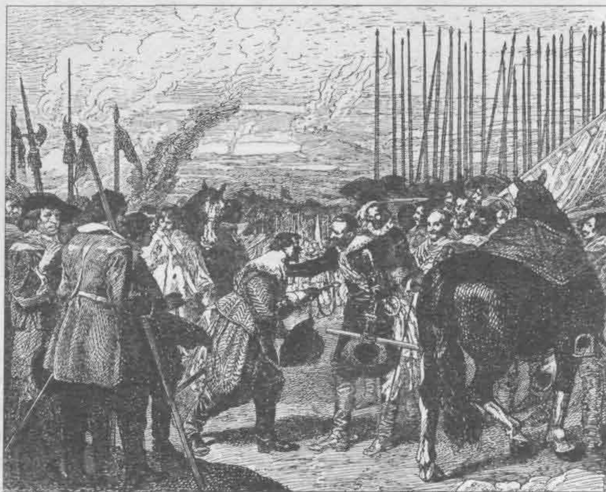
Рис. 539. Диего Веласкес. Сдача Бреды