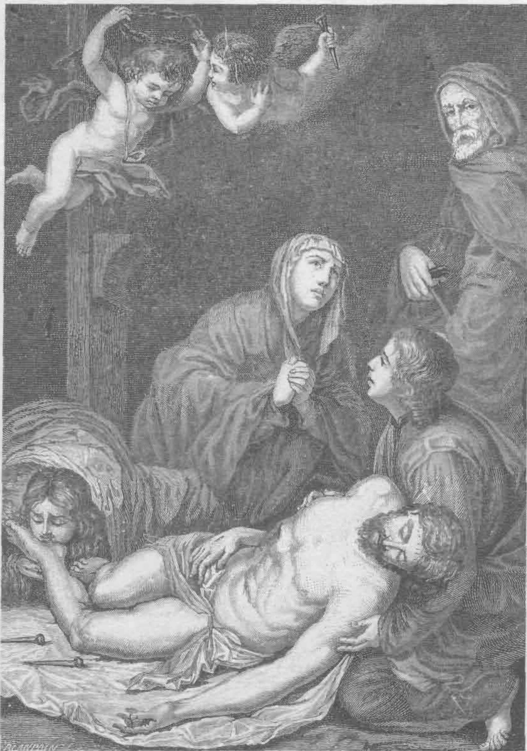
Рис. 533. Хусепе де Рибера. Снятие со креста

Рибера по направлению и школе близок итальянской традиции, однако пылкий испанский темперамент разительно отличает его от итальянцев (рис. 533, 535). Его композиции, наполненные контрастами световых эффектов, несут на себе отпечаток сумасбродства и самой разнузданной фантазии. С особенным вниманием он останавливался на изображениях пыток. Нередко его картины изобилуют изображениями святых с полубодранной кожей (рис. 534).