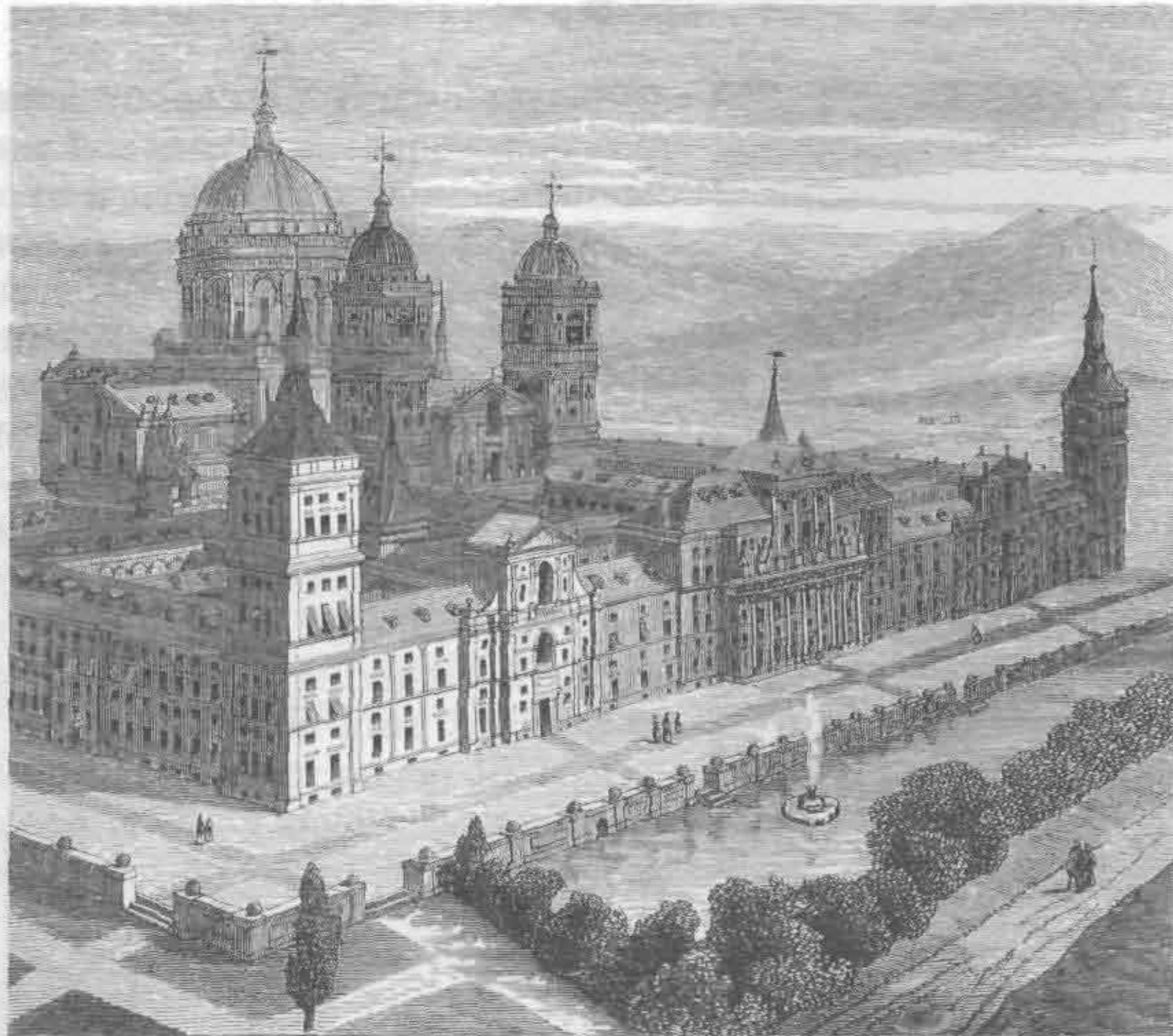
Рис. 529. Эскуриал, дворец Филиппа II