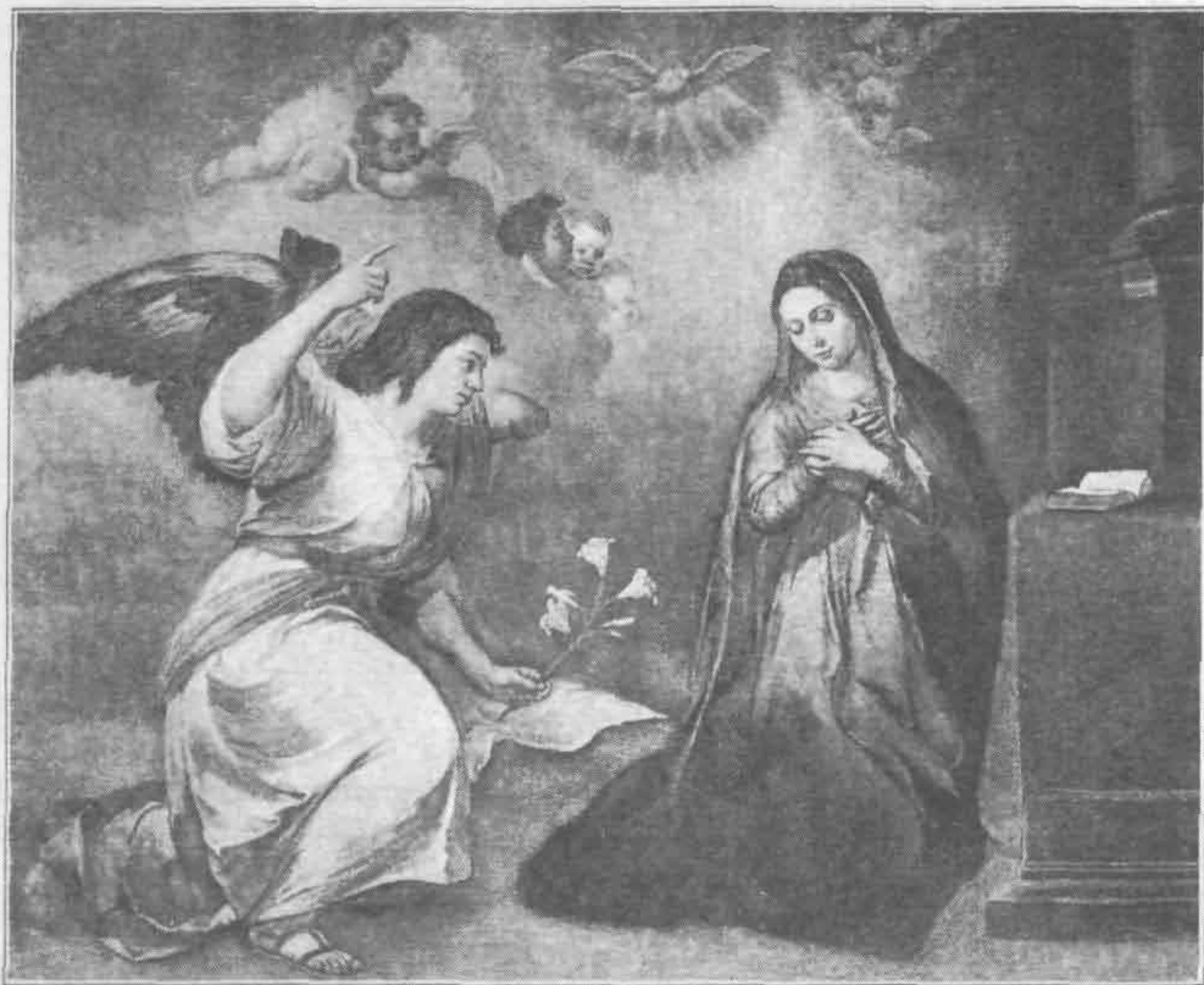
Рис. 543. Бартоломе Эстебан Мурильо. Благовещение

Все произведения Мурильо проникнуты религиозным чувством, но его Мадонны иногда кажутся слишком экзальтированными и недостаточно отрешившимися от земного. Мурильо — реалист по натуре, и, работая для церквей в идеальном направлении, он все же не отступал от реальных земных форм. В некоторых картинах отчетливо выражены искренние чувства, но строго возвышенного духа и величавого спокойствия, свойственного Рафаэлю, среди них нет (рис. 543).