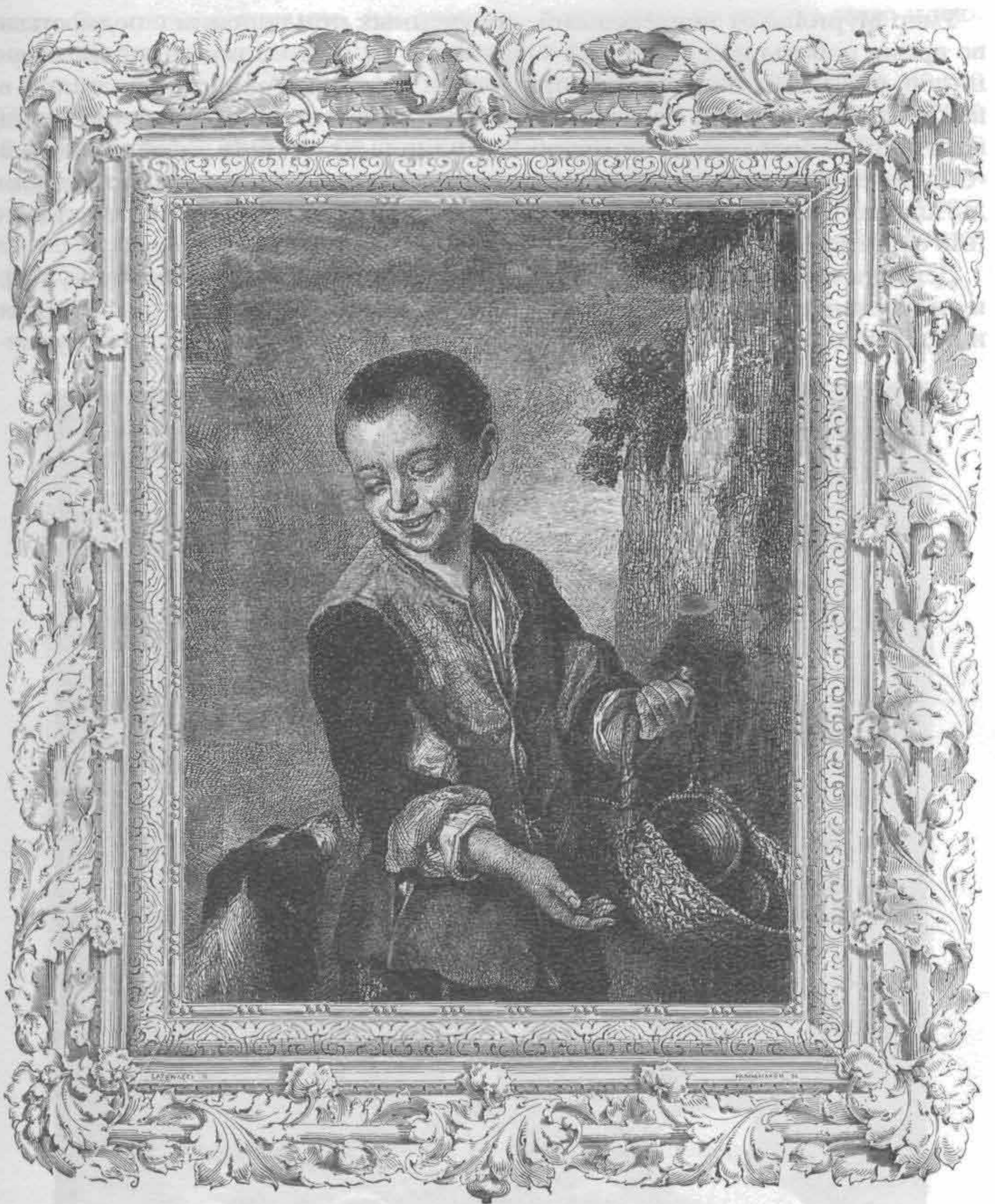
Рис. 541. Бартоломе Эстебан Мурильо. Мальчик с собакой

По возвращении на родину Мурильо завалили заказами. Он стал обеспеченным человеком и смог жениться на богатой девушке. Придворная жизнь не прельщала художника, и он отдался исполнению заказов для соборов и монастырей. Монахи старались приобрести его произведения, способствуя популярности художника не только в придворных кругах, но и среди католиков Испании вообще. В 1660 году он основал в Севилье академию художеств, где сам обучал учеников в натурном классе.