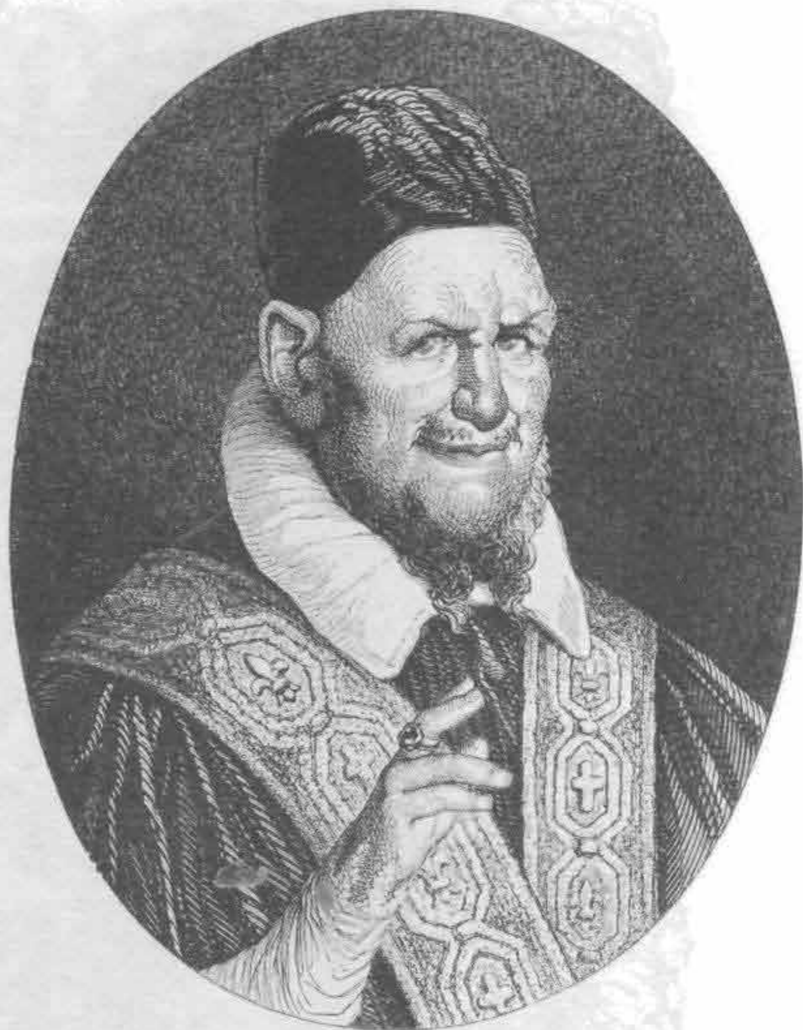
Рис. 538. Диего Веласкес. Иннокентий X

Энергия юноши была огромной, а посещение выставки только подстегнуло ее: он еще с большим рвением принялся за писание образков, продал их целую партию и отправился в Мадрид пешком, на-