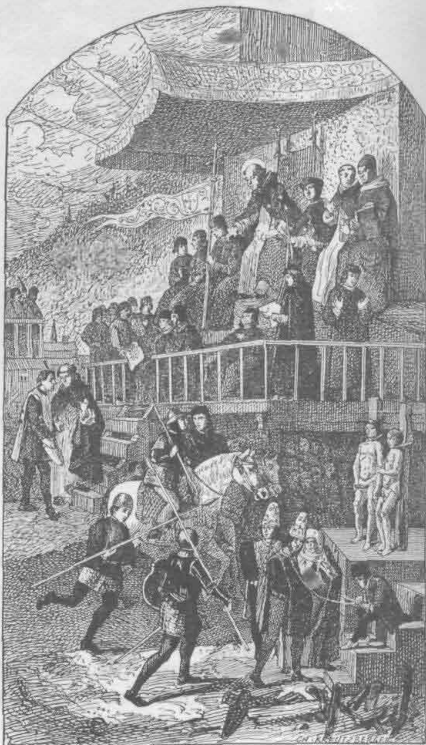
Рис. 531. Алонсо Берругете. Аутодафе

Первым испанским художником, получившим известность у себя в стране, считается Хуан Деборгоньо, расписавший фрес-