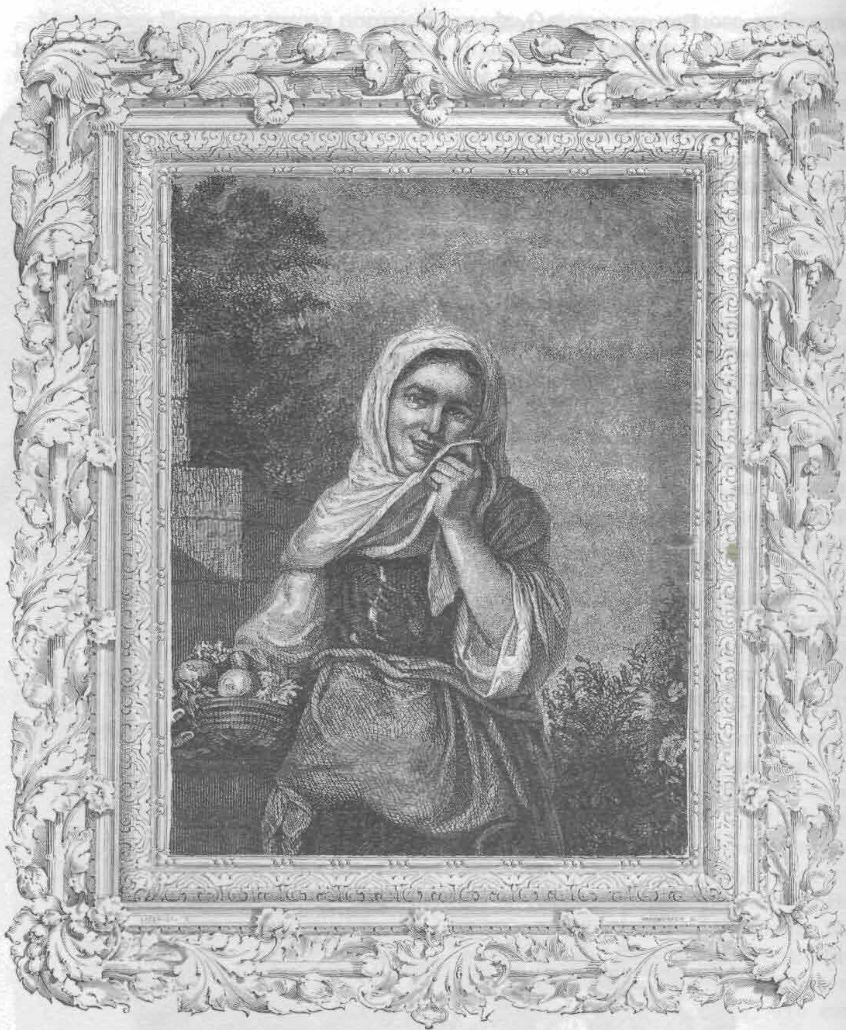
Рис. 540. Бартоломе Эстебан Мурильо. Девочка с плодами

деясь оттуда перебраться в Италию. Слава Веласкеса привела юношу в его мастерскую. Веласкес, убедившись в таланте Мурильо, достал ему разрешение работать в Эскуриале с оригиналов. Веласкес не пустил ученика в Италию, считая, что тому необходимо вначале развить нужную технику.